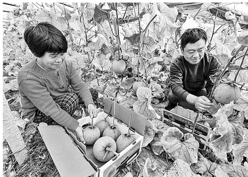
11月1日，河北省阜城县贵平瓜菜种植专业合作社的种植户在采摘“西州蜜25号”哈密瓜。河北省阜城县发挥科技对农业产业的支撑作用，分别与河北省农林科学院、河北农业大学等单位签署战略合作协议，引进“西州蜜25号”哈密瓜。目前全县已种植6000多亩，成为当地农民增收的又一亮点。