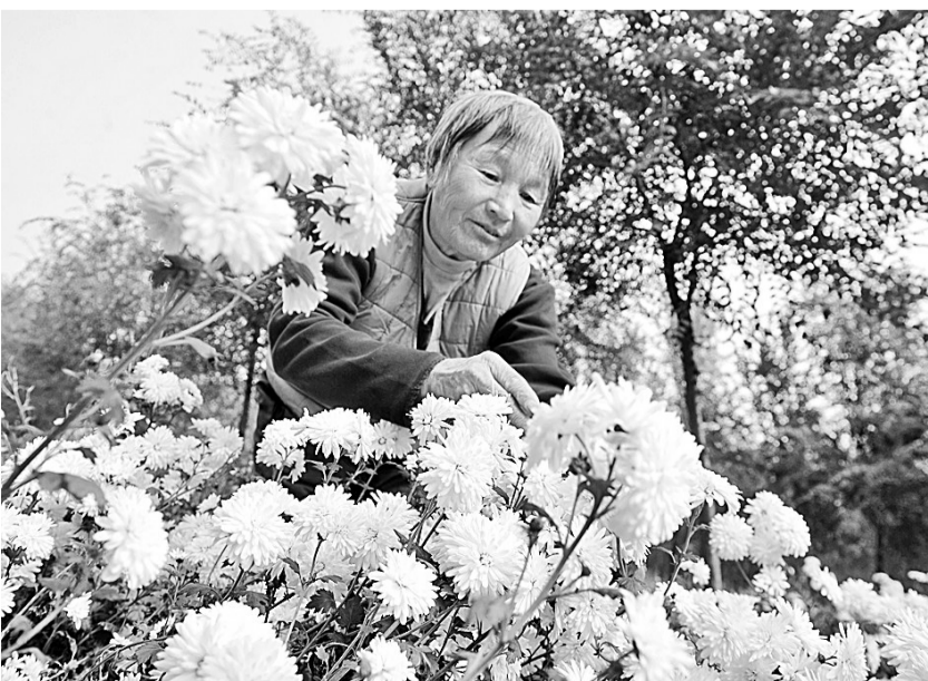
11月1日，吴桥县各园高村农民在采摘林下种植的药用菊花。近年来，河北省吴桥县在推进精准扶贫过程中，利用林下土地资源从事种植、养殖等产业，使农林牧各业资源共享、优势互补，形成良性生态循环体系。目前，吴桥县发展林下经济3000余亩，带动8000余户农民增收。