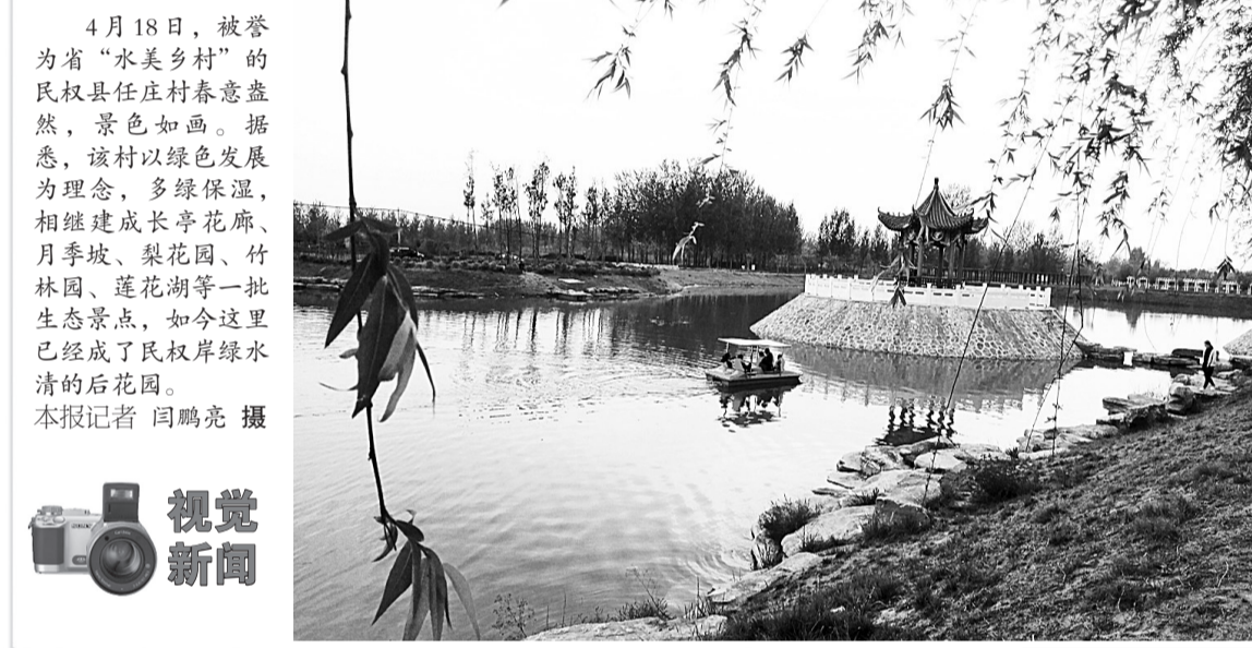
4月18日,被誉为省“水美乡村”的民权县任庄村春意盎然,景色如画。据悉,该村以绿色发展为理念,多绿保绿,相继建成长廊花廊、月季坡、梨花园、竹林园、莲花湖等一批生态景点,如今这里已经成了民权岸绿水清的后花园。