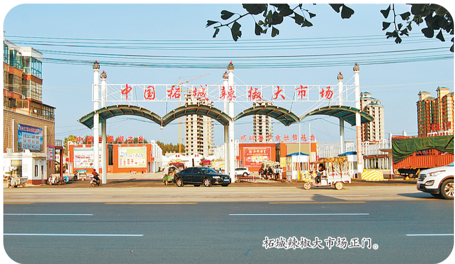
柘城辣椒大市场正门。