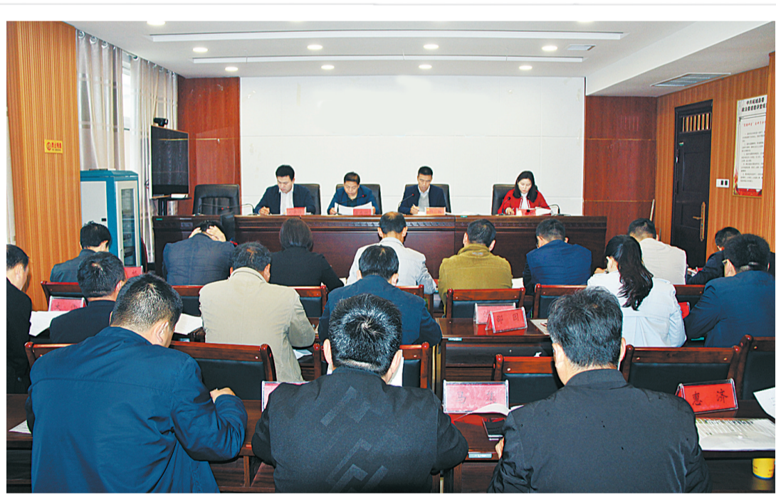
近日，柘城县委统战部、县工商联联合“百企帮百村”帮扶企业——柘城县恒康医院，启动了为全县特困群体静脉曲张和疝气患者开展免费医疗救助的活动。这个活动，旨在为柘城县贫困静脉曲张和疝气患者免费实施手术，让贫困家庭进一步摆脱因病致贫的困境。图为活动启动现场。

作为承办单位，九三学社商丘市委按照九三学社河南省委的要求，全力投入到这项工作中来，确保将这项扶贫济困、利民惠民的好事在柘城县落地开花。