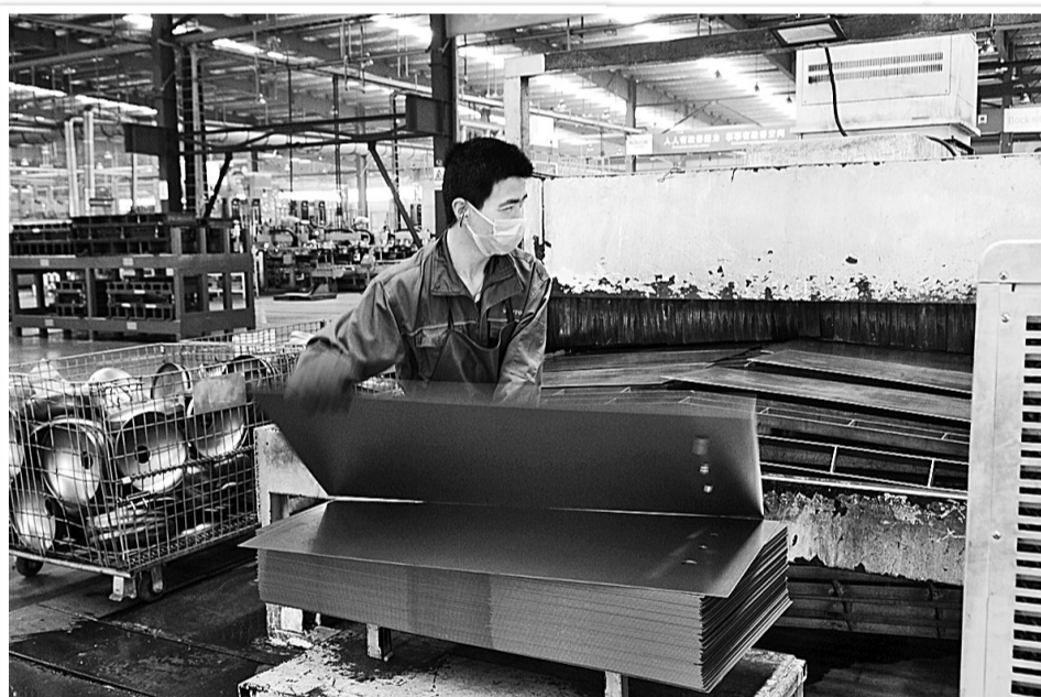
4月25日,河南阿诗丹顿电气有限公司员工在车间忙碌。该公司位于民权县高新技术开发区内,拥有电热水器、吸油烟机、燃气灶、消毒柜、集成灶、浴霸等一系列产品200多个品种,年产值可达30亿元,创利税3.5亿元,提供就业岗位800余个。

切实加强基层党建。利用“半小时学习”规定动作,带领村“两委”党员干部认真学习领会习近平总书记在两会上重要讲话精神,确保两会精神在基层落地生根。加强“两委”换届的宣传工作,组织党员群众认真学习有关“两委”换届选举的法律法规、政策性文件,确保换届选举风清气正。市委办公室、市委组织部、市卫计委、市人社局、市民政局等在联系点积极宣传了党和政府的各项精神要求和政策措施。大力维护信访稳定。对当前群众反映突出的土地征用、房屋拆迁、农民工欠薪