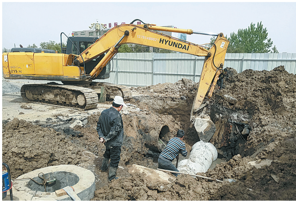
5月7日，施工人员在南京路忠民河桥旁铺设地下污水管网。据了解，忠民河污水管网铺设完成后，沿河污水通过污水管网将被输送到第八污水处理厂进行处理。