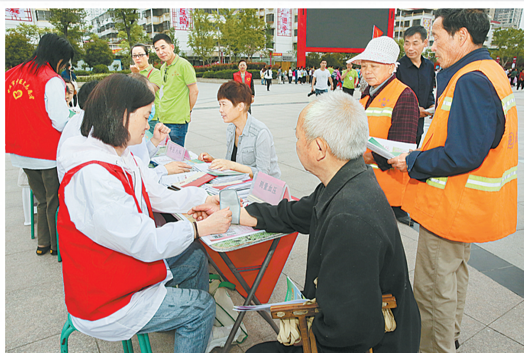
近日，博爱志愿者联合会青年志愿者在市青年志愿者公园开展义诊活动。义诊现场，青年志愿者为市民听诊、量血压等，同时还发放健康宣传手册，充分展现了当代青年志愿者的风采。