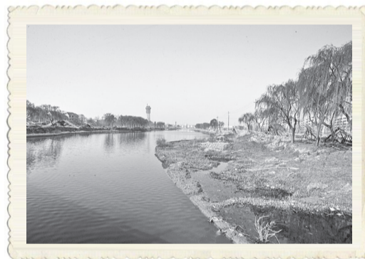
▲2005年拍摄的周商运河华夏路西侧。

▲记者今年7月7日在同一地点拍摄的周商运河华夏路西侧，现如今变得岸美水绿、高楼林立，已成为市区一景，是市民休闲娱乐好去处。