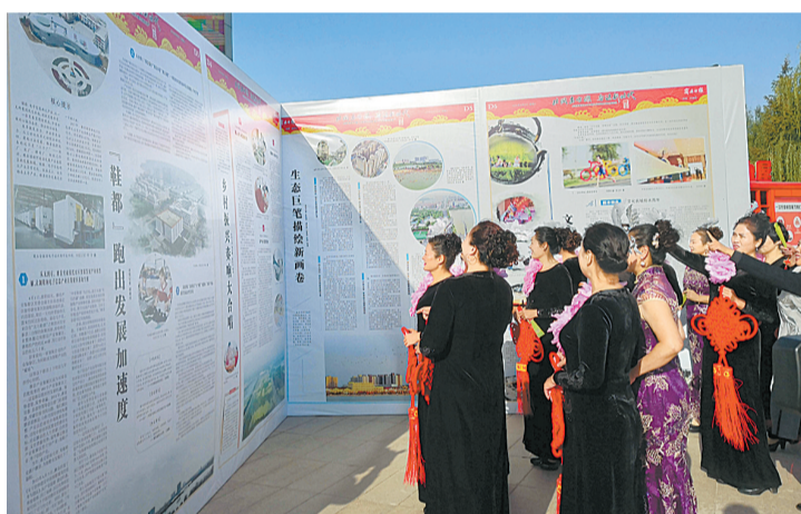
商丘成就融媒体百版巨报展睢县版前读者络绎不绝。

睢县成就大型主题报道巨报展成为一大亮点,《党旗领航开启新征程》《“鞋都”跑出发展加速度》《乡村振兴奏响大合唱》《生态巨笔描绘新画卷》《文