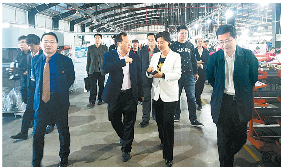
全国百家媒体商丘行采风团成员深入河南(睢县)嘉鸿鞋业进行采访。

本报讯(记者 黄业波 通讯员 甄林)金秋十月,天高气爽。10月27日下午,2018全国“百家媒体商丘行”采风团一行100余人走进睢县,感受中原水城制鞋、电子比翼双飞新风采,品读古城睢州雅致灵动的文化韵味,聆听“千年古城、百年州府”历史钟声的激越回响。