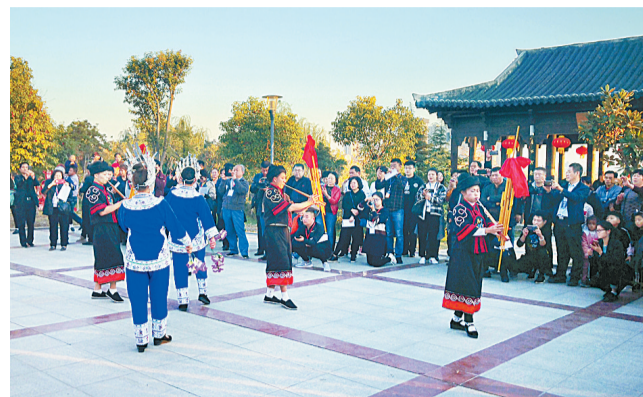
睢县水腾睢源水族表演团在襄园为游客进行表演。