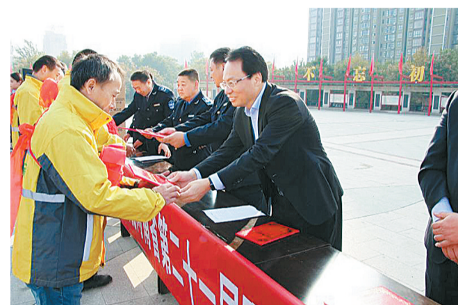
10月31日上午,民权县对在环卫战线上爱岗敬业、无私奉献的十佳城市美容师、环卫工作先进单位及先进个人进行表彰。当日,爱心企业万家乐超市、东方超市、国凯置业等15家企业还为环卫工人进行捐助。