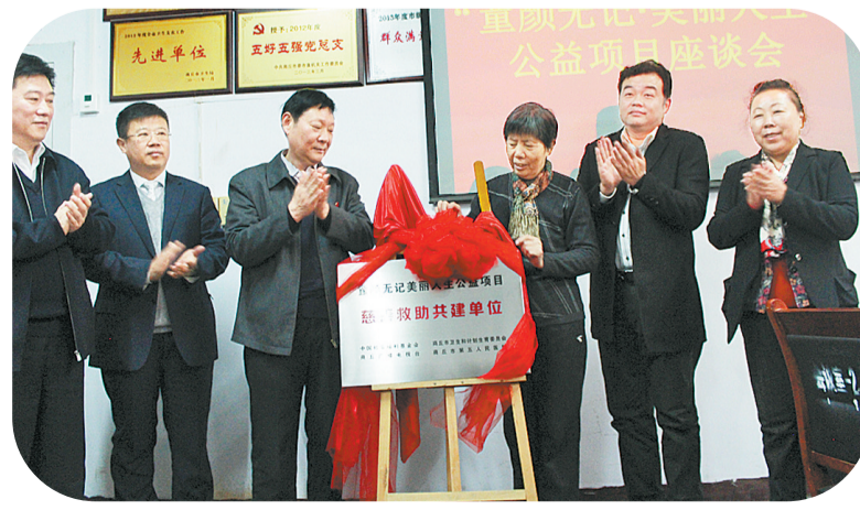
“童颜无记美丽人生公益项目”慈善救助共建单位揭牌