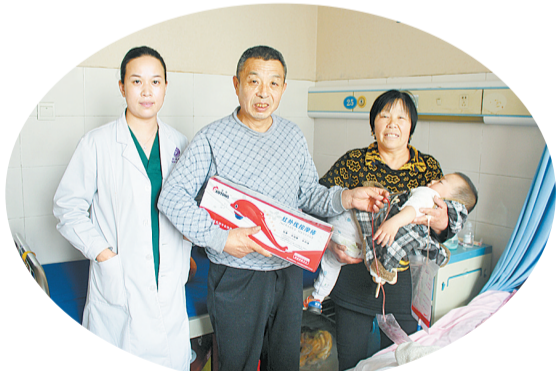
重阳节慰问患者父母