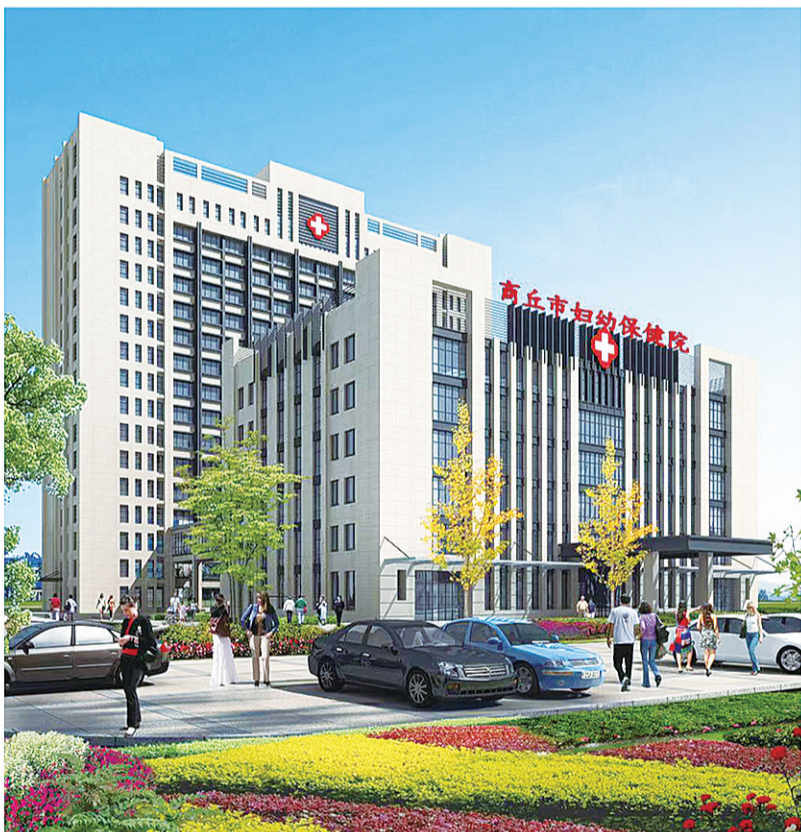
医院新院址效果图