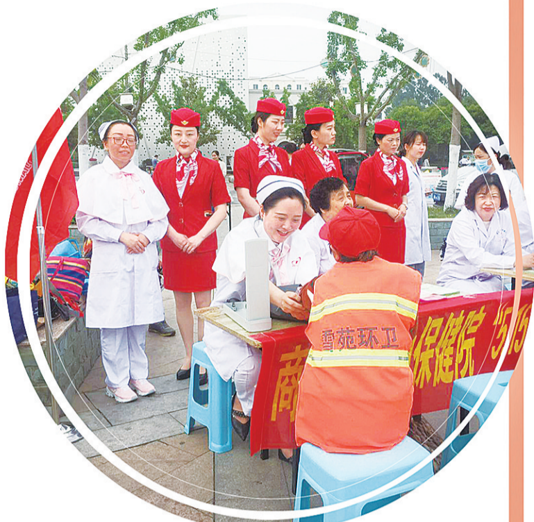
妇产科专家在好人广场为环卫工人义诊

该院坚持以强化管理，改善医疗服务，规范医疗行为，提高医疗质量，确保医疗安全，服务人民健康为目标，努力降低孕产妇死亡率和儿童死亡率，提高出生人口素质，树妇幼文明新风，展白衣天使风采。