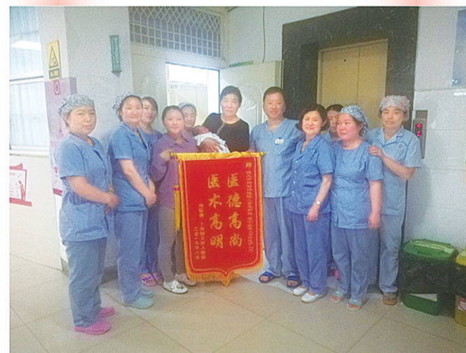
精湛医术和优质护理，受到患者的一致好评，患者赠送锦旗表示感谢。