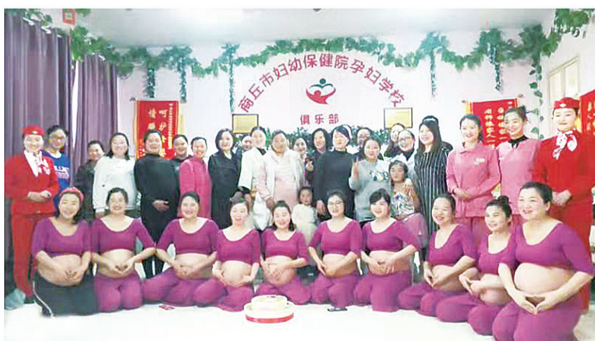
孕产学校里孕妈们合影留念