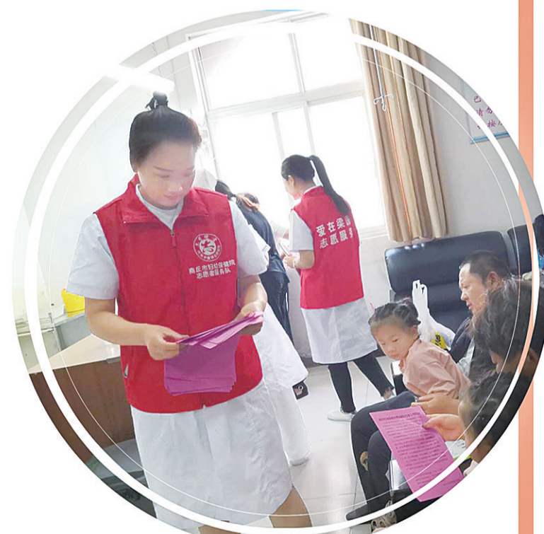
志愿者为群众科普健康知识