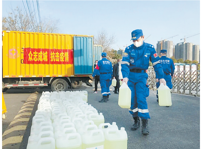
蓝天队员搬运防疫物资。