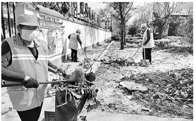
4月9日，梁园区环卫工人神火大道东侧集中清理绿化带内枯枝腐叶。随着天气转暖，枯枝腐叶影响卫生，环卫部门组织工人逐片进行清理，确保城市整洁卫生，排除隐患。

本报讯（梁磊）3月31日，在全省交通运输执法工作视频会议上，民权县交通运输局执法大队荣获“全省交通运输执法先进基层大队”称号（全省十个），为全市唯一。 近年来，特别是在去年，民权县交通运输局执法大队凝心聚力，求真务实，围绕治超工作、路域治理、运政执法等重点任务，开展了民权县交通运输执法工作新篇章。 始终保持高压态势，巩固治超工作成果。2019年，该队共检测车辆1191054辆次，查处超限车辆460辆次，卸货9034.7吨，交警处罚48万余元，计扣2086分。取得的成绩在全省位居前列。 路政执法日益加强，路域环境明显改善。该队重点围绕“保护路产路权，保障公路畅通”的工作原则，常态化开展以违法建筑、马路市场、广告招牌、涉路施工、桥下空间为重点的路域环境集中整治。 运政执法稳中求进，客运市场秩序井然。该队结合实际情况，制订针对性的治理方案，开展24小时盯守执法、错时执法；划分重点执法区域，重点对火车站、汽车站等人员密集区及后街主要路段进行巡查；加大执法巡查频次；对死灰复燃的黑驾校进行突击治理，坚守执法底线，极大震慑和打击了长期存在的欺行霸市、垄断经营行为。