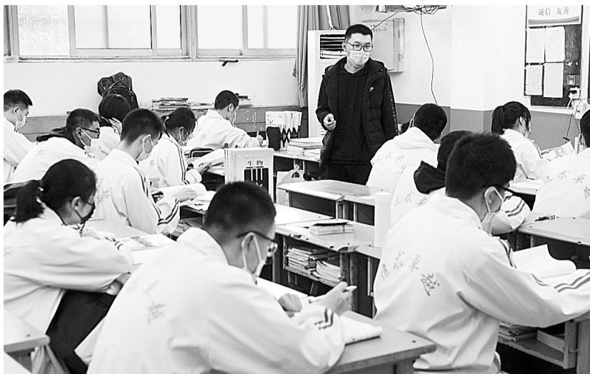
4月7日，市一高的学生们走进久违的教室，准备高考冲刺。

“学校一天无死角消毒两次，每周还会请专业的消毒公司来校园消毒。”市回民中学负责人告诉记者，现在每个教室里还安装有两台紫外线消毒灯。在物资储备上，有酒精、消毒液、口罩、防护服等防疫物资，另外学校还有疑似隔离观察室和发烧隔离观察室。每个学生每