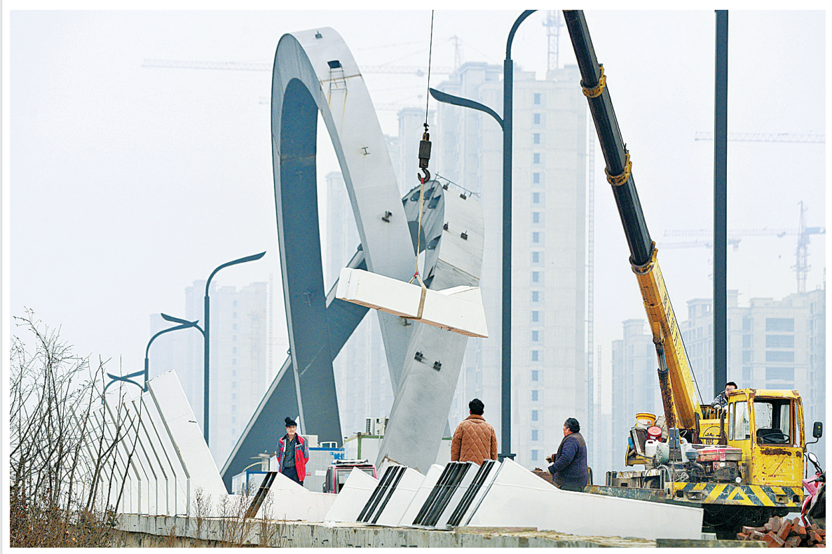
1月5日，施工人员在迎宾路日月河桥吊装钢结构。迎宾路日月河桥主体工程已完工并正常通车，近日，施工人员开始对桥体造型结构进行完善，完工后日月河桥将以新的造型展现在市民面前。

市公安局交警支队铁骑大队负责人李志峰告诉记者：“每一次的奋力前行，每一次的全力奔跑，只为一心服务群众。危难时刻，挺身而出，我们的队员一次次用点滴行动诠释着商丘交警铁骑为人民的宗旨。”