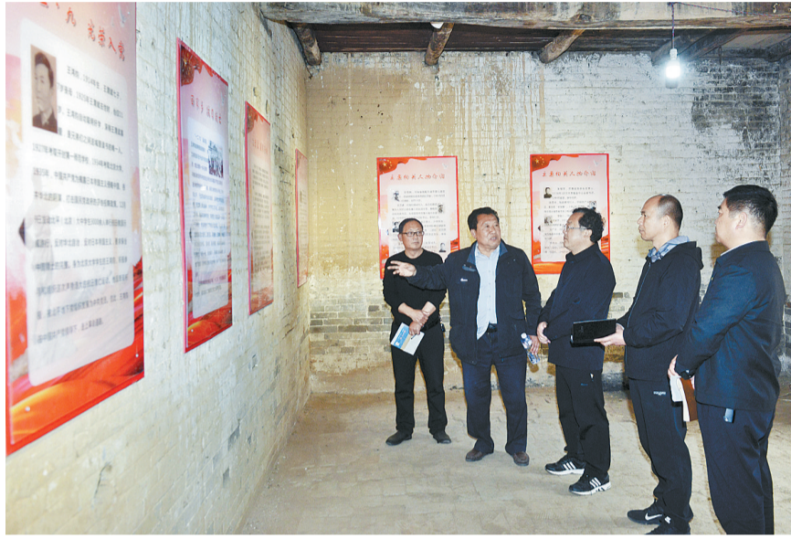
在王氏三烈士纪念馆内，采访组通过观看展板了解“王氏三烈士”的革命事迹。

4月13日，商丘日报“百年华诞寻初心”采访组来到匡城乡英王村，探访“王氏三烈士”抗击日本侵略者的悲壮故事。在村党群服务中心旁边，王氏三烈士纪念馆——两栋两层16间老房子，历经沧桑，依旧巍然矗立。