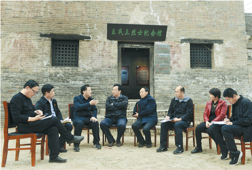
在王氏三烈士纪念馆内，采访组与当地学者、干部、村民座谈。