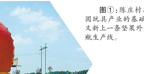
图①:陈庄村在巩固玩具产业的基础上,又新上一条坚果外包装瓶生产线。