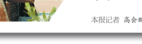
图②:村民在陈庄村文化广场上游玩。