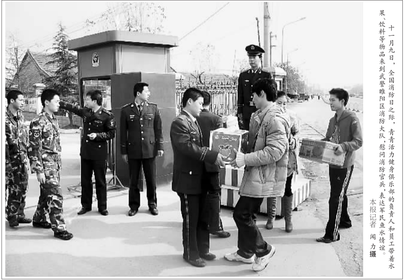
十一月九日，全国消防日之际，青青活力健身俱乐部的负责人和员工带着水果、饮料等物品来到武警睢阳区消防大队，慰问消防官兵，表达军民鱼水情谊。