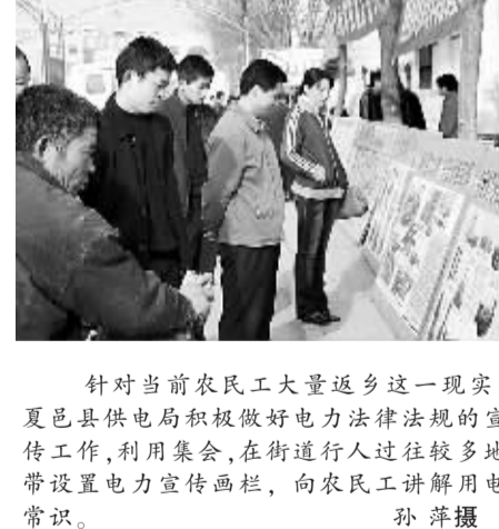
针对当前农民工大量返乡这一现实,夏邑县供电局积极做好电力法律法规的宣传培训工作,利用集会,在街道行人过往较地带设置电力宣传栏,向农民讲解用电常识。

伯党乡民生工程惠民生 本报讯(户瑞生)民权县伯党回族乡一直注重民生工程。入冬以来,该乡早动手、早组织、争主动,注重协调,加大力度,对本乡境内4条沟渠进行整治,总计疏浚沟渠20公里,动土30万方,植树9000株,在今年完成“四位一体”沼气工程112座的基础上,市县农业局又为伯党乡追加国债沼气工程170座。