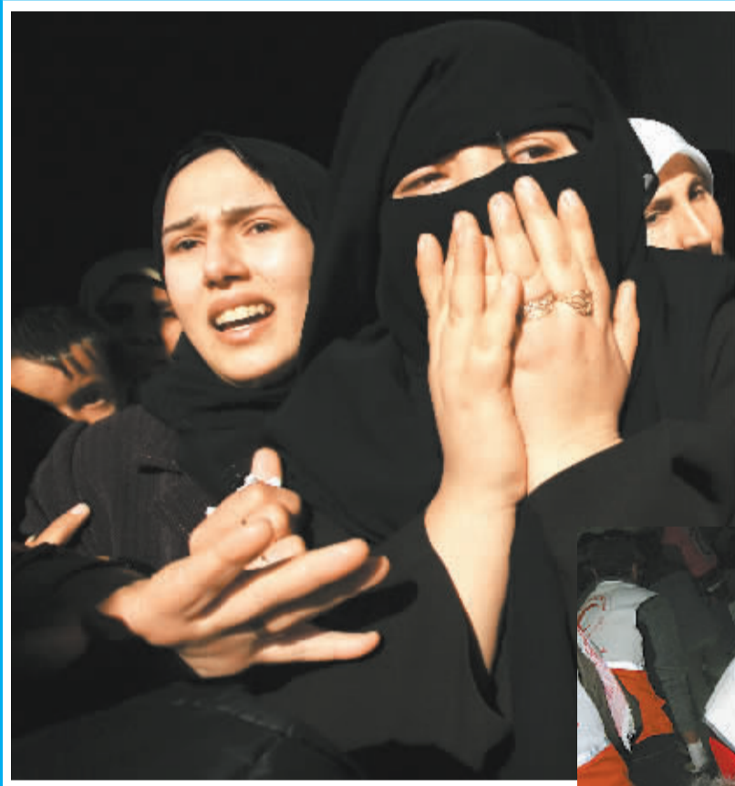
▲1月5日,在加沙南部拉法难民营举行的哈马斯成员穆罕默德·阿布·沙尔的葬礼上,几名巴勒斯坦妇女伤心地哭泣。