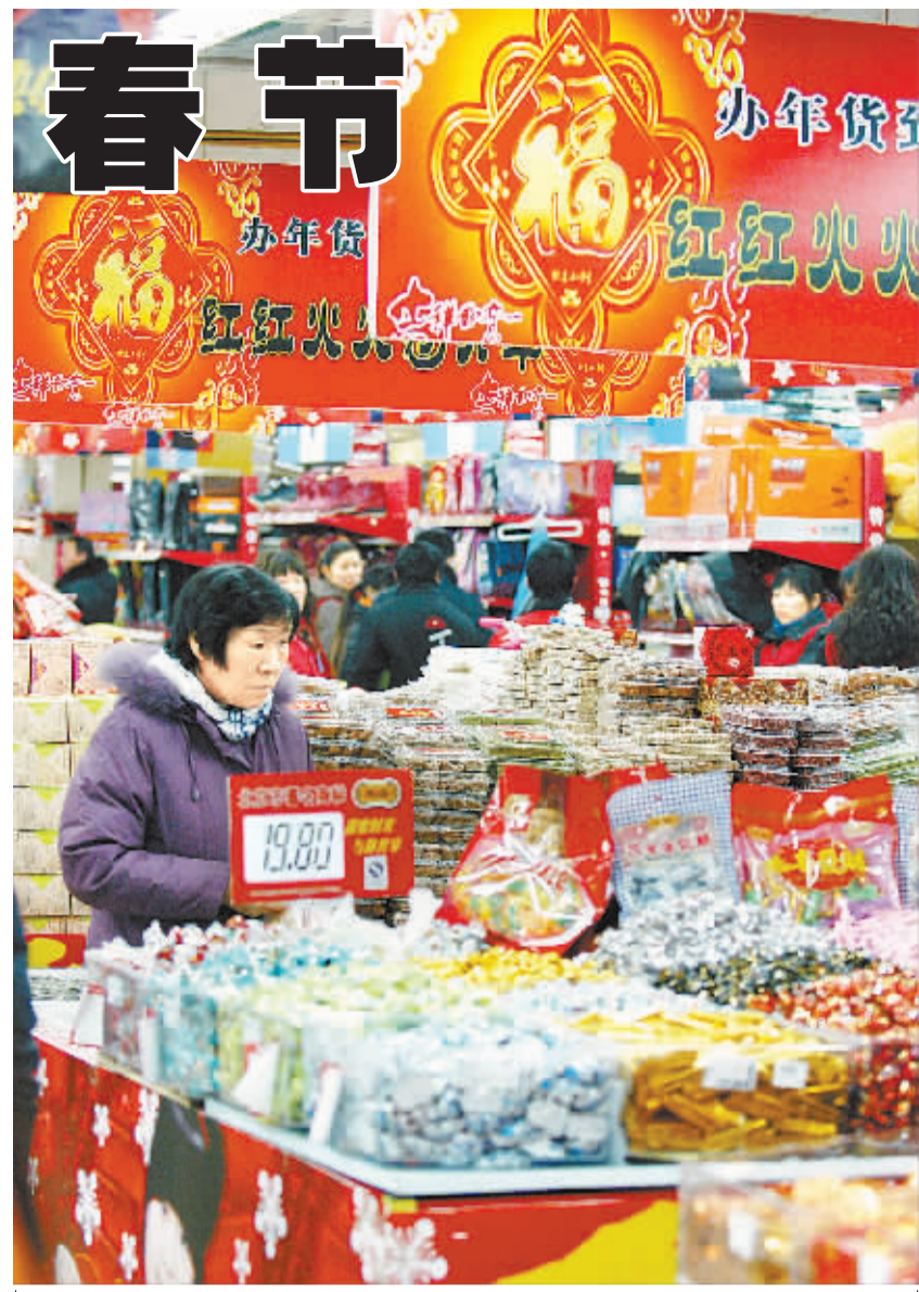
1月12日下午,一位女士在京港百货选购糖果。虽然离春节还有十多天,我市各大超市已经年味十足。