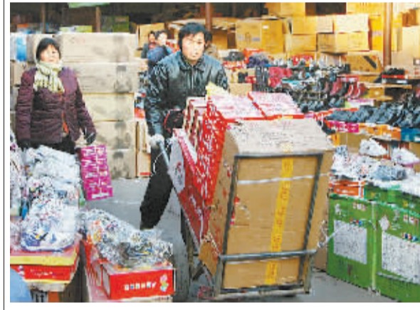
1月12日下午,在菜鞋帽批发市场,商贩们将批发的年货运往各县农村市场。

正如他们所说的,寒冷的冬天气里,农产品中心批发市场处处呈现一派繁荣和谐的美好景象,人们的脸上洋溢着幸福的笑容。