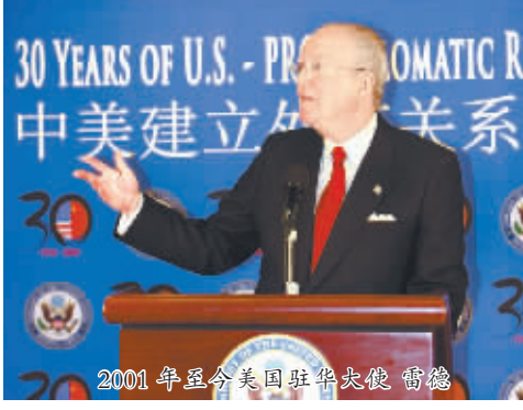
2001年至今美国驻华大使 雷德