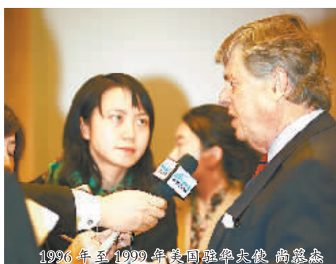
1996年至1999年美国驻华大使 尚慕杰