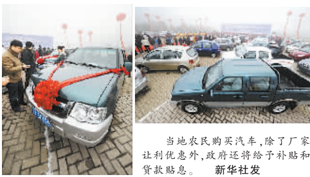
当地农民购买汽车，除了厂家让利优惠外，政府还将给予补贴和贷款贴息。