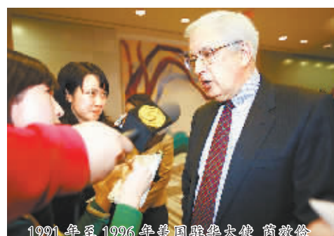
1991年至1996年美国驻华大使 芮效俭