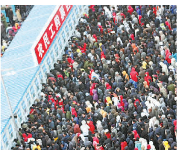
1月12日是2009年春运的第2天，铁路北京西站迎来购票高峰，广场上的农民工购票区人山人海。