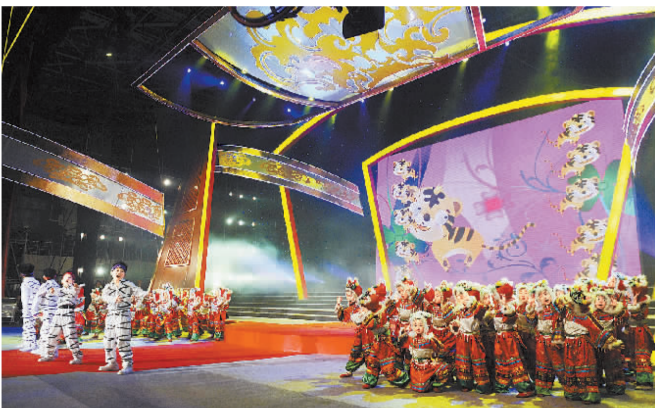
10月15日晚,一群“虎娃”在晚会上表演舞蹈《虎虎生威成长精神》。当晚,“王亥杯”杰出华商奖颁奖晚会在市体育馆隆重举行。