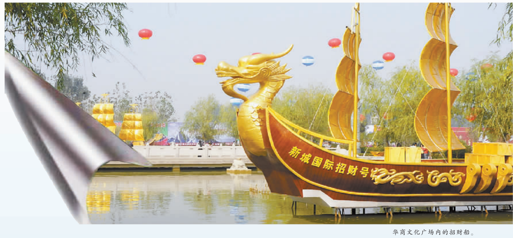
华商文化广场内的招财船。