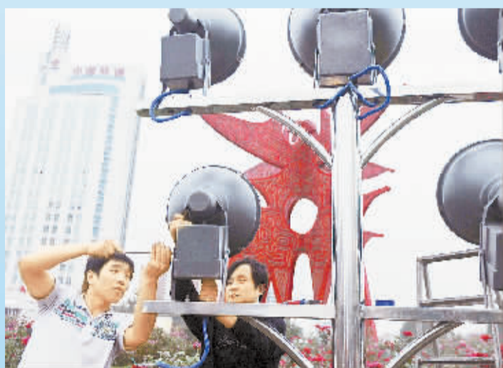
工作人员正在调试商字环路的景观灯。