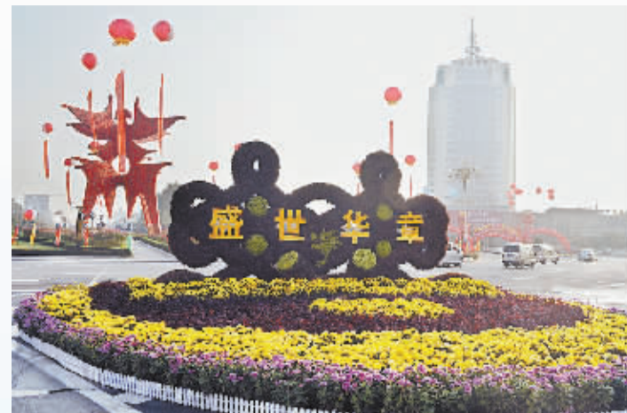
被鲜花装扮一新的市容。