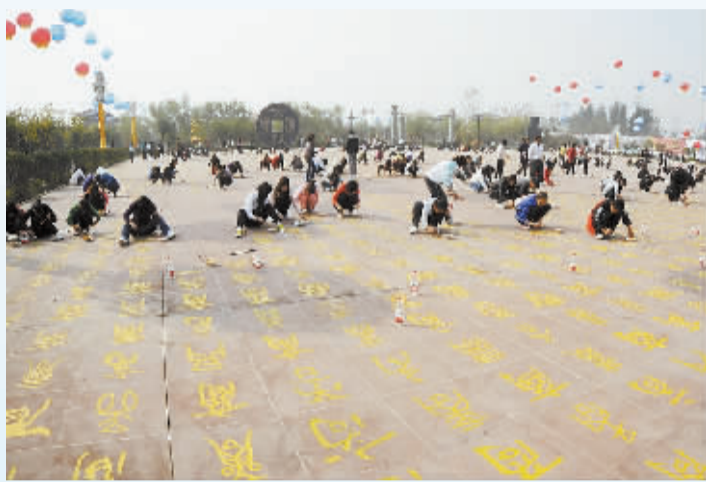
青年志愿者在华商文化广场为万商广场上的“商”字上色。