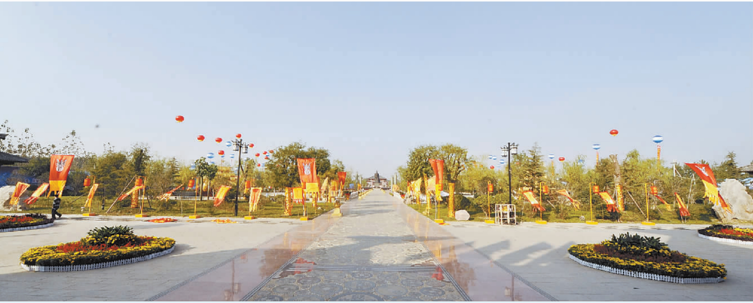
鲜花锦簇、红旗飘扬，经过三期的升级与改造，华商文化广场更好地展现了世代华商一脉相承的文化和内涵，并以崭新的面貌喜迎各方宾客的到来。