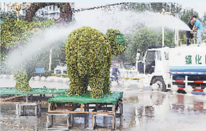
工作人员正在清洁市容。