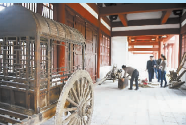
工作人员在华商文化广场展厅摆放展品。