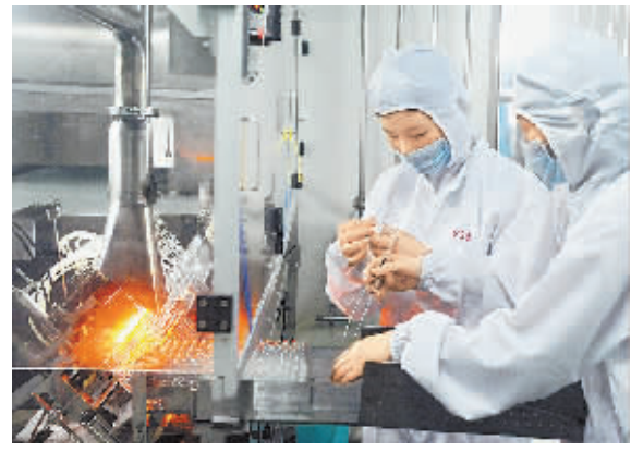
哈森(商丘)药业公司依托母公司上海现代制药股份有限公司及上海医学院强大的产品研发为背景,根据市场的需求着手产品的研发,已开发出心脑血管类、抗菌消炎类、治疗糖尿病类等系列50多个品种,使公司生产品种达到150多个。图为哈森(商丘)公司注射剂生产车间。