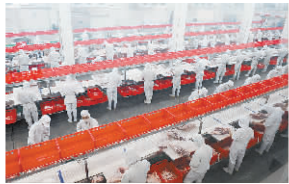
永城众品食品股份有限公司的员工在年产10万吨无公害猪肉系列生产线紧张生产。