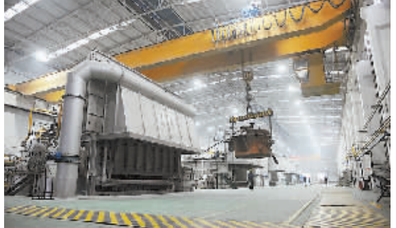
阳光铝材生产车间。