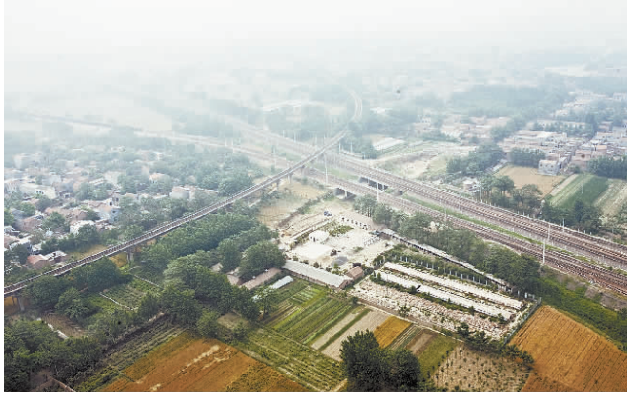
京九、陇海铁路在商丘交会成黄金十字架。

睢阳区共签约11个项目。 其中有：由中农集团投资的生物肥及仓储物流项目，总投资7500万元，年产90万吨塔复合肥、造粒复合肥及物流、仓储项目；原商丘市物资建材公司旧城改造项目，该项目位于文化路与凯旋路交叉口东南角，占地9.6亩，居民200人，需拆迁2万平方米，总建筑面积15万平方米，高层商住；家具加工项目，占地30亩；五星酒店、国际会展中心、大型购物商场和住宅小区开发项目，总投资12亿元。该项目占地110亩，项目区域长330米，宽230米，建筑面积26.1万平方米，建成后形成购物、休闲、娱乐、会展、金融、商住为一体的高档综合居住新区。