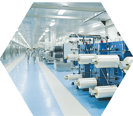
示范区永煤碳纤维生产车间。