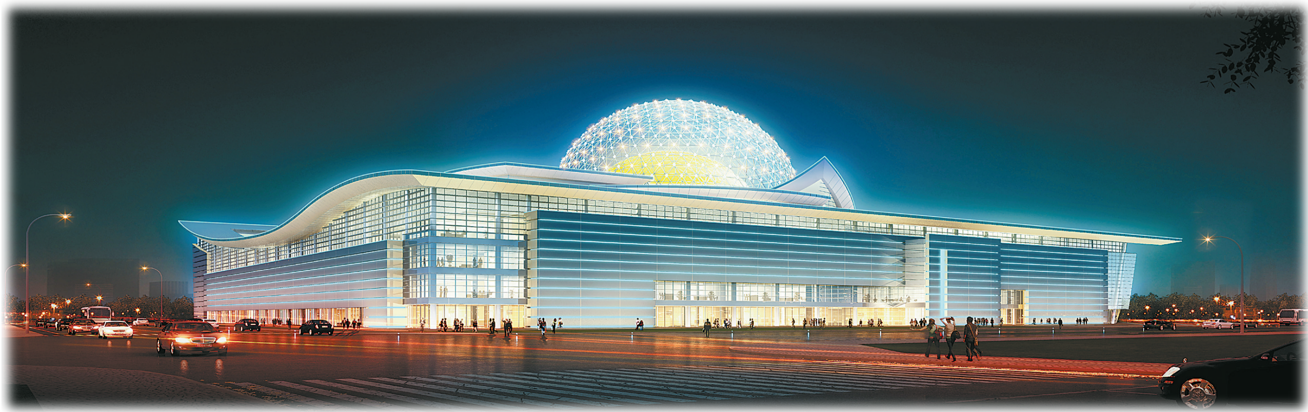
商丘大剧院效果图。