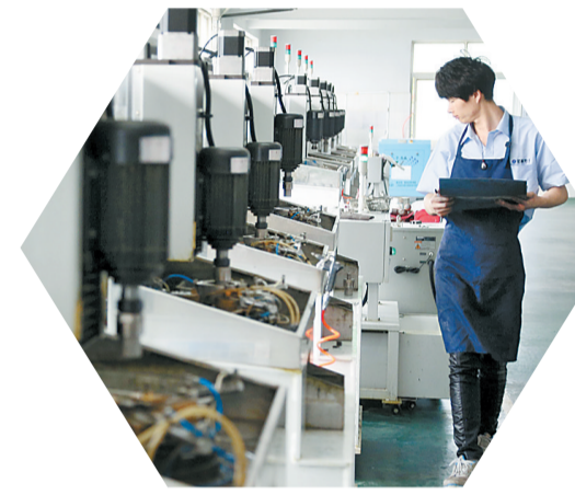
星林电子现代化生产车间。