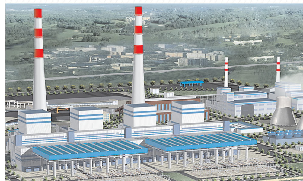
商丘民生热电厂效果图。民生热电厂项目占地约460亩，由中电国际集团投资32亿元建设，建设规模为2×35万千瓦，是全省6个热电厂项目之一、重点能源工程，也是商丘投资最大的单体工业项目。该项目建成后，不仅能够提供大量用电量，还能提供暖气、冷气和就业岗位。

行补偿和安置，确保群众利益不受损失；二是对具备入住条件的社区及时分配和收款，缩短群众漂泊和租房时间，节约财政资金；三是加快推进和平、和悦、平安、董庄、惠馨纳入3P项目范畴，快速推进中州新城、和美二三期等在建社区建设；四是对没安置的群众要有专门的机构跟踪，及时解决他们生产生活中遇到的困难；五是免费对群众进行技能培训，对困难群体积极开发环卫、绿化、保安等公益性岗位进行安置；六是持续完善建成社区的配套建设，强化内部管理，使群众搬得进、住得好。