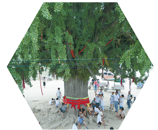
商丘植物园坐落地——沈楼村的西汉银杏树。