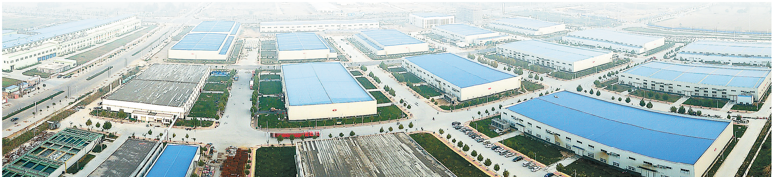
(富士康)金振源电子科技产业园鸟瞰