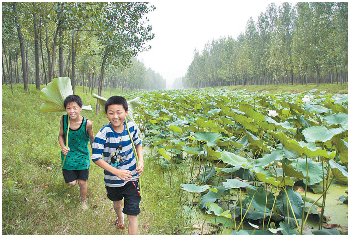
到2020年，大沙河两岸6公里滨河公园初步建成；有条件的农村基本建成美丽乡村。

实现“十三五”发展目标，必须始终坚持人民主体地位，坚持科学发展，坚持深化改革，坚持依法治国，坚持党的领导，深刻理解、准确把握、自觉践行创新、协调、绿色、开放、共享的发展理念，始终贯穿于“十三五”乃至今后一个时期发展的各方面和全过程。