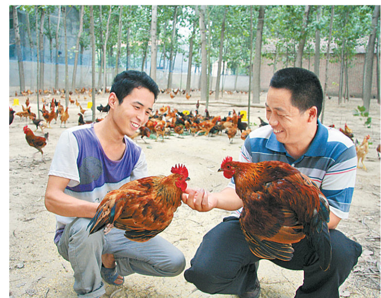
到2020年，地区生产总值和城乡居民人均收入比2010年翻一番以上，全面建成小康社会。