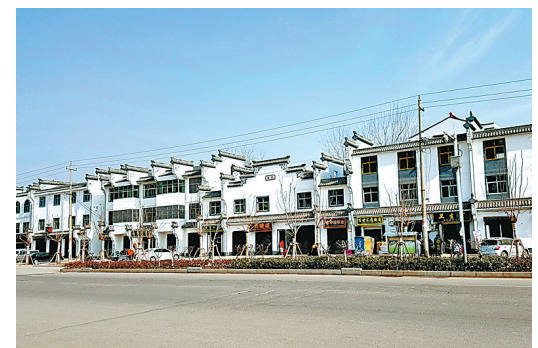
夏邑县城雪枫路上的徽派风韵。