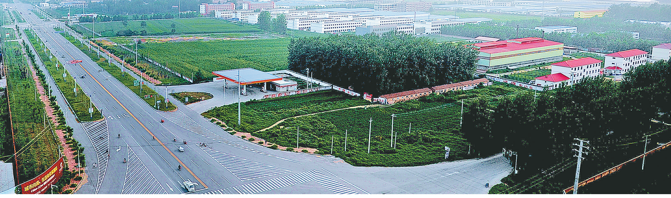
大气磅礴的长寿大道。