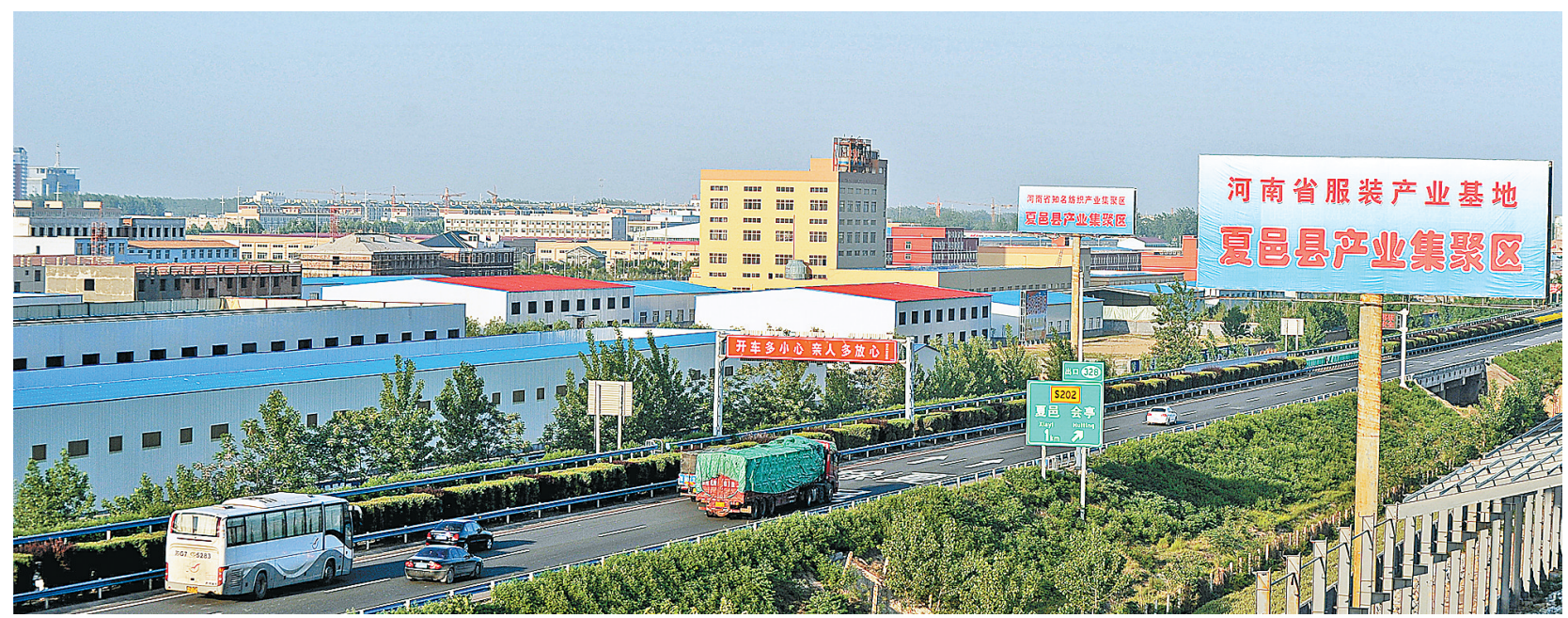
夏邑县产业集聚区远眺。

通过五年努力，全县纺纱规模达到260万锭以上，织布能力15万吨以上，服装加工能力达到2亿件以上，形成纺织、印染、织布、服装一条龙产业化格局。中原国际商贸港建材家居业态投入运营，华丰益佰等商贸项目初具规模；新落地重点工业项目全部开工建设，城建重点工程进展顺利。其中，华盛木业、双联食品、杰瑞服饰、露尔佳织造、金晶生化二期等相继建成投产；赛琪体育工业园、永安织造、志永达纺织、火店镇20兆瓦光伏发电、远东织造等项目快速推进。全县安排省、市重点项目19个、152亿元，2015年计划投资58.3亿元，实际完成投资60.1亿元，占年度目标任务的103%；争取中央预算内投资项目164个、5.4亿元，均按计划顺利推进。