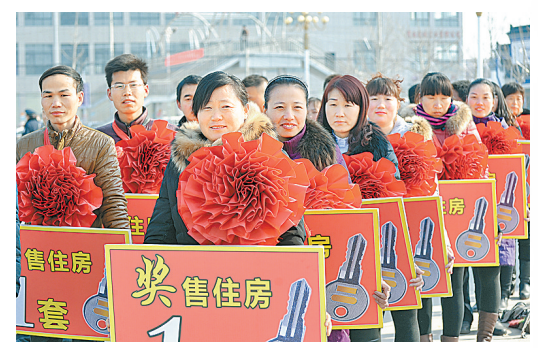
夏邑县产业集聚区优秀员工喜领奖售住房。

业学校，均设有纺织专业与与纺织有关的计算机、机电一体化、服装设计专业，每年为夏邑纺织服装企业培养1000至2000名专业技术人员和高层次的技术工人，为产业发展提供了坚强的人才支撑。搭建科研平台，破解技术研发瓶颈。永安纺织、华鹏纺织、大洋纱线等企业都有自己的研发团队和研发中心。永安纺织攻克了一般棉花代替长绒棉技术，经济效益明显提升，被河南省纺织行业协会授予“豫东纺织培训检测中心”。