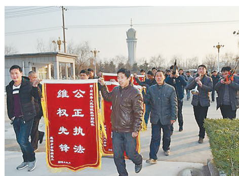
群众为法院送锦旗。