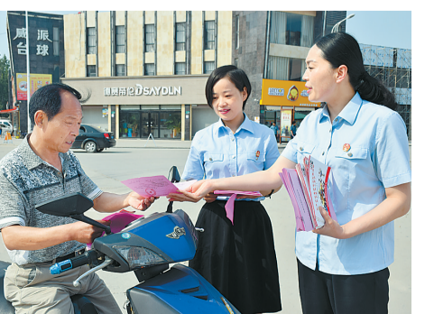
法官走上街头发放普法宣传单。