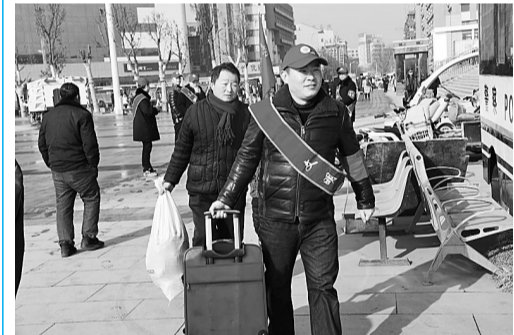
春节期间，商丘市人民检察院10名干警来到商丘火车站，开展“检察机关志愿者春运献爱心”活动。