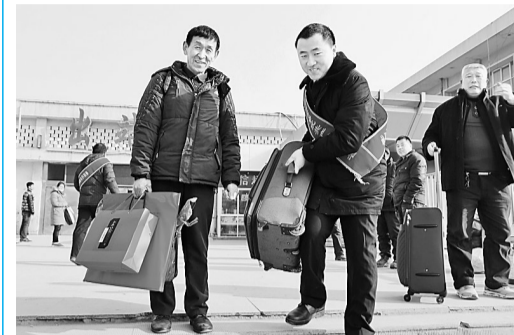
春节期间，梁园区人民检察院干警来到商丘火车站为旅客真心服务，以自己的爱心换来旅客们真诚的微笑。

编者按： 春节期间是人流、物流、财流高度集中的时期，是矛盾纠纷和案件的高发期。为了让群众安心过大年，连日来，全市广大政法干警牢记使命、不负重托，艰苦奋斗、连续作战，始终把维护国家和社会稳定置于工作首位，在社区、在监所、在大街、在小巷、在广场、在庙会，他们始终走在打击犯罪第一线、维稳安保最前沿和服务群众最前列，全力以赴做好值班备勤、治安防控各项工作，切实维护好春节期间的社会秩序，为维护社会和谐稳定、促进社会公平正义、保障人民安居乐业做出了突出贡献。现编辑一组全市政法干警春节期间坚守岗位稿件，以飨读者。