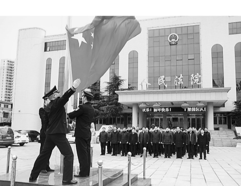
2月14日，春节过后第一个工作日，梁园区人民法院举行了庄严的升国旗仪式，激励干警在新的年度奋勇向前，用自己的实际行动，努力践行让人民群众满意的总要求。