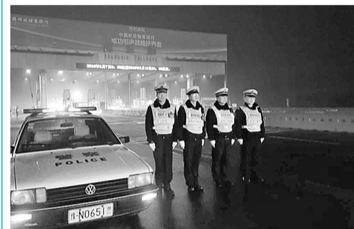
2月7日，除夕夜，商丘市公安局高速交警大队民警在高速公路收费站执勤。