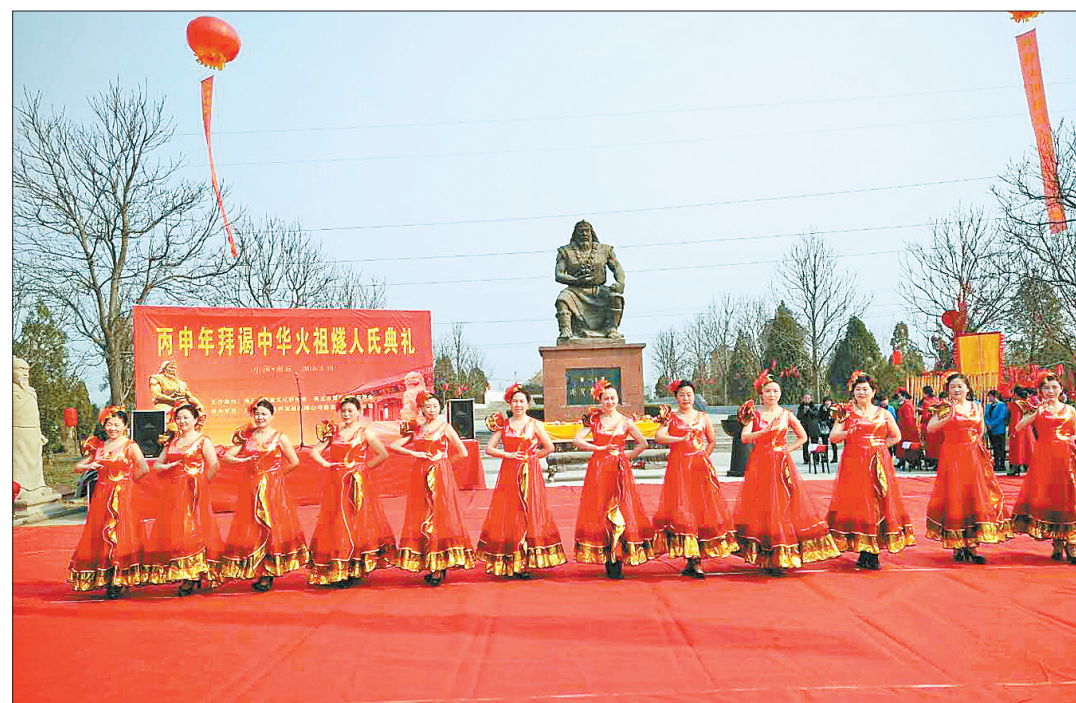
“二月二，龙抬头”。相传二月初二是三皇之首的燧人氏的诞辰。3月10日上午，在商丘火文化景区燧皇陵前，鼓乐阵阵，鞭炮齐鸣，丙申年拜谒中华始祖燧人氏大典在此举行。本次活动由商丘市炎黄文化研究会、商丘市国学文化促进会主办，由商丘古城旅游发展有限公司燧皇陵景区分公司承办，旨在纪念人文始祖，弘扬商丘文化。图为庆典现场盛大的演出活动。