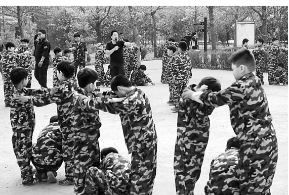
4月17日,小朋友在我市郊区一家室外拓展训练机构参加拓展训练。不少家长双休日带着孩子参加野外拓展训练,增强身体素质。