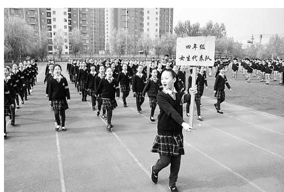
日前,市第一实验小学第十六届学生运动会隆重开幕。仪式在雄壮激昂的进行曲中开始,同学们手擎国旗、会徽昂首阔步向主席台走来。