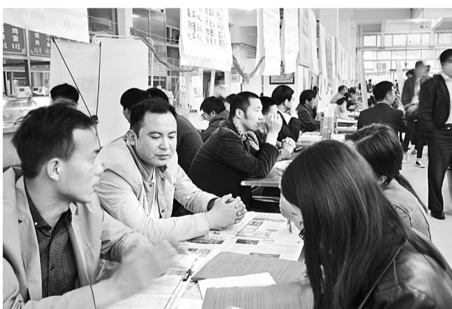
4月16日,由商丘市大中专毕业生就业指导工作领导小组办公室主办、商丘师范学院承办的“2016年大中专毕业生双向选择洽谈会”在商丘师范学院平原路校区举行。据统计,本次双向选择洽谈会中进场求职者有6200余人,而与企业初步达成意向的有3700余人。