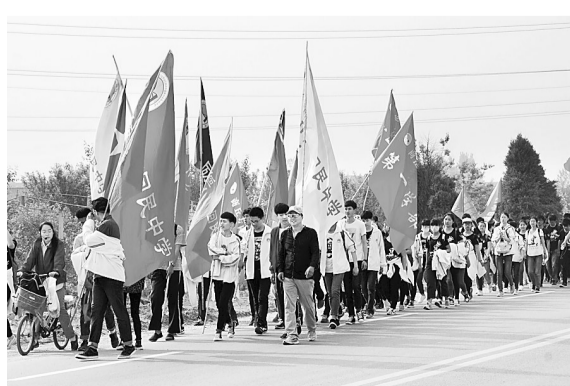
4月14日,市回民中学高二年级“青春励志”远足拉练活动正在举行。活动中,学生们从学校出发,徒步到森林公园,全程26公里。