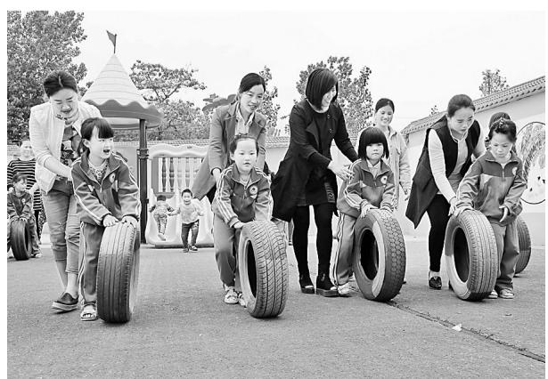
日前,民权县王桥镇中心幼儿园邀请家长与孩子一起做亲子游戏。