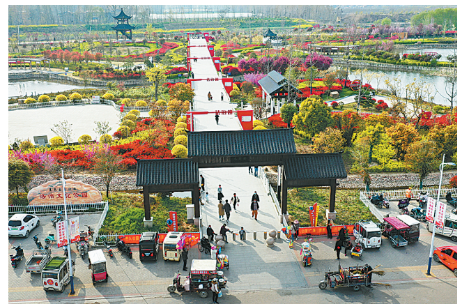
4月6日,航拍下的夏邑县法治文化公园。随着气温逐渐回升,公园内春意盎然,万紫千红,美不胜收,成为一道靓丽的风景线,吸引市民赏春游玩。

本报讯(记者 李良勇 通讯员 张旭 侯亚飞)“八五”普法以来,民权县稳步推进“法律明白人”培养工程,着力打造共建共治共享的乡村治理模式,在助力乡村振兴、推进基层法治和道德建设中发挥了积极作用。 该县将“法律明白人”作为服务乡村振兴战略、推进法治乡村建设的重要举措压紧各级主体层层落实,结合党员活动日活动,深入各村(居)委会进行摸排,通过自荐、推荐、遴选等严格程序主动学习法律知识、热心普法公益事业、善做群众工作的村(居)民作为“法律明白人”候选人。他们采用“集中辅导+个人自学”等学习模式,组建“法律明白人”培训宣讲团分赴各乡镇开展宣讲,邀请优秀律师、法学专家等开展有关涉农法律法规知识、征地拆迁等基层生产生活实际和多发的典型案例进行释法答疑,并依托道德讲堂开展普法故事宣讲。 同时,该县挖掘选树先进典型,培育一批以村(居)委会干部、人民调解员等基层群众自治力量为重点的“法律明白人”。此外,该县还采取多种措施,培养善于法律服务、热心纠纷调处的“多面手”,高质效服务法治乡村建设。截至目前,该县培养普通“法律明白人”1800余人,骨干“法律明白人”529人,参与法治宣传2万余人次,参与社会事务管理350件次,引导法律服务682件,化解矛盾纠纷2790件。