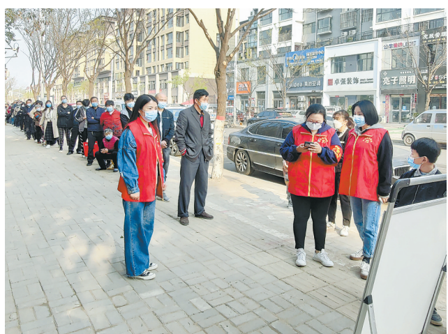
4月6日,民权县人民法院组织18名志愿者到民欣花园核酸检测点开展志愿服务工作。

看到陷入沉思的物业公司负责人,段超峰趁势而上,从公司对员工负有哪些管理责任和安全教育义务,以及如何进行管理、安全教育、以后该怎么避免类似的风险等方面,对物业公司负责人进行现场普法。最终,物业公司同意让步,与小花各承担一半责任,同意接受小花五万元的追偿款。双方当事人当场达成了一致调解意见,签署了调解协议。