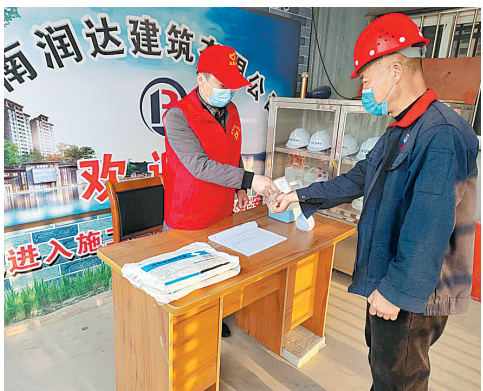
在虞城河南润达建筑有限公司,上班的工人正在检测体温。

本报融媒体记者 刘建说 撰 本报(记者 刘建说 通讯员 李林林)当前,疫情防控工作严峻复杂,虞城县住建局将项目工地监管作为重点工作,定岗定责,压实责任,统筹推进抓好扬尘污染治理和疫情防控工作。