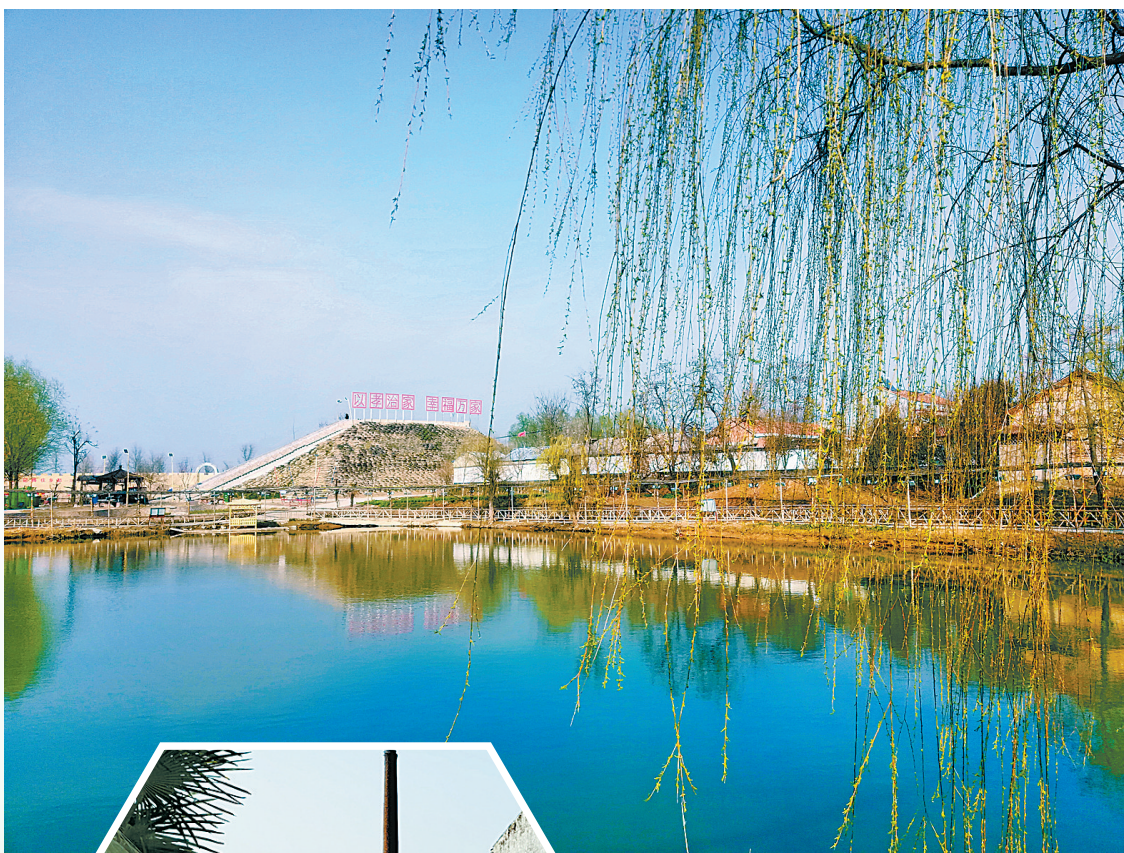
▲4月11日,记者在虞城县城郭乡郭土楼村拍摄到的人工湖景观。近年来,该村改造旧坑塘,引水入村,打造水景观,改善了人居环境。