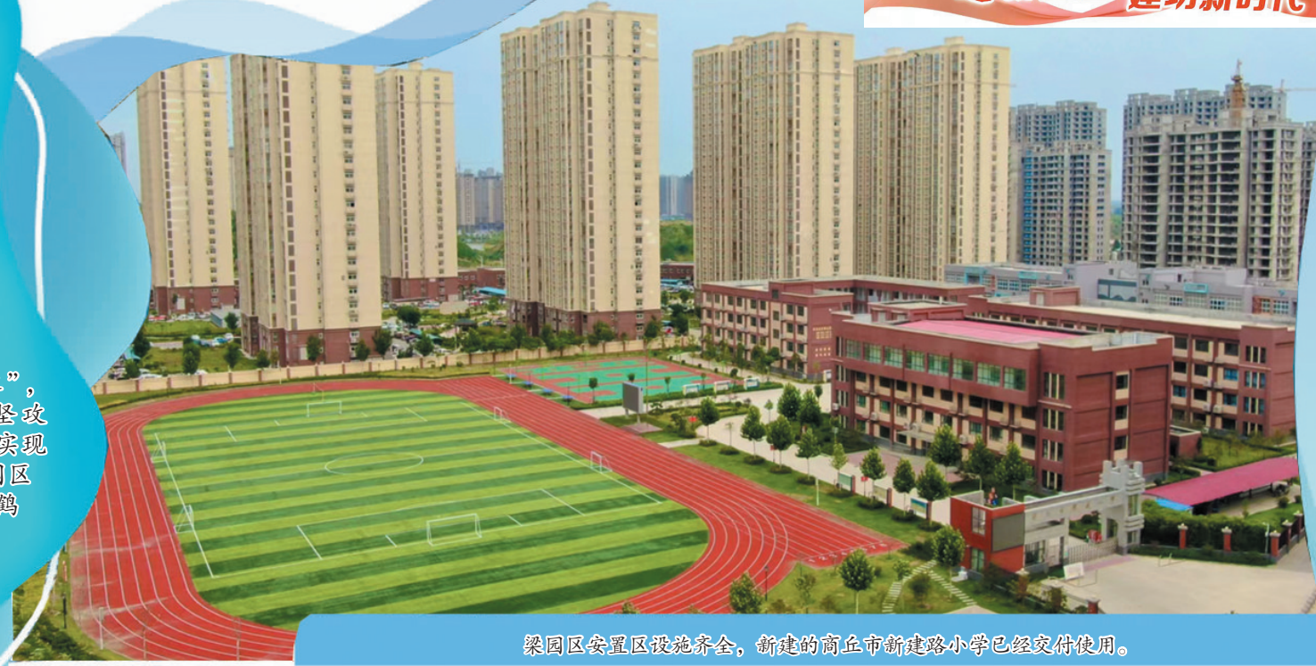
梁园区安置区设施齐全,新建的商丘市新建路小学已经交付使用。

摆开“十大阵容”,凝聚全区之力,克坚攻难,勇往直前,奋力实现经济发展高质量,梁园区迸发出一个“晴空一鹤排云上,便引诗情到碧霄”的冲天态势。