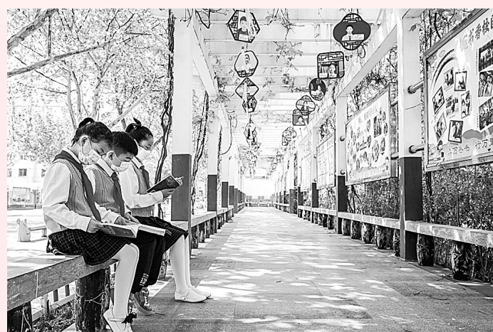
4月25日,民权县实验小学的孩子们在读书长廊阅读课外读本。据悉,民权率先在全市注册开通了“书香民权”全民阅读微信公众账号,目前已有近万名党员干部关注该公众账号,参与线上线下读书。

为了培养学生正确的劳动价值观,4月25日,民权县第一初级中学举行了劳动教育周活动。同学们来到了该校劳动实践基地——民权县青少年研学营地,对民权葡萄酒的发展及制作过程进行了实地参观和劳动体验。孩子们从认识葡萄品种、葡萄酒品牌开始,到葡萄酒的酿制、储藏、装罐、出厂过程。在这里,孩子们参观了葡萄酒博物馆,了解了民权葡萄酒发展的辉煌历史和深厚的酒文化,学习了悠久的农耕文化,让他们亲身体验农耕劳动,感受劳动的辛苦和劳动成果的来之不易。