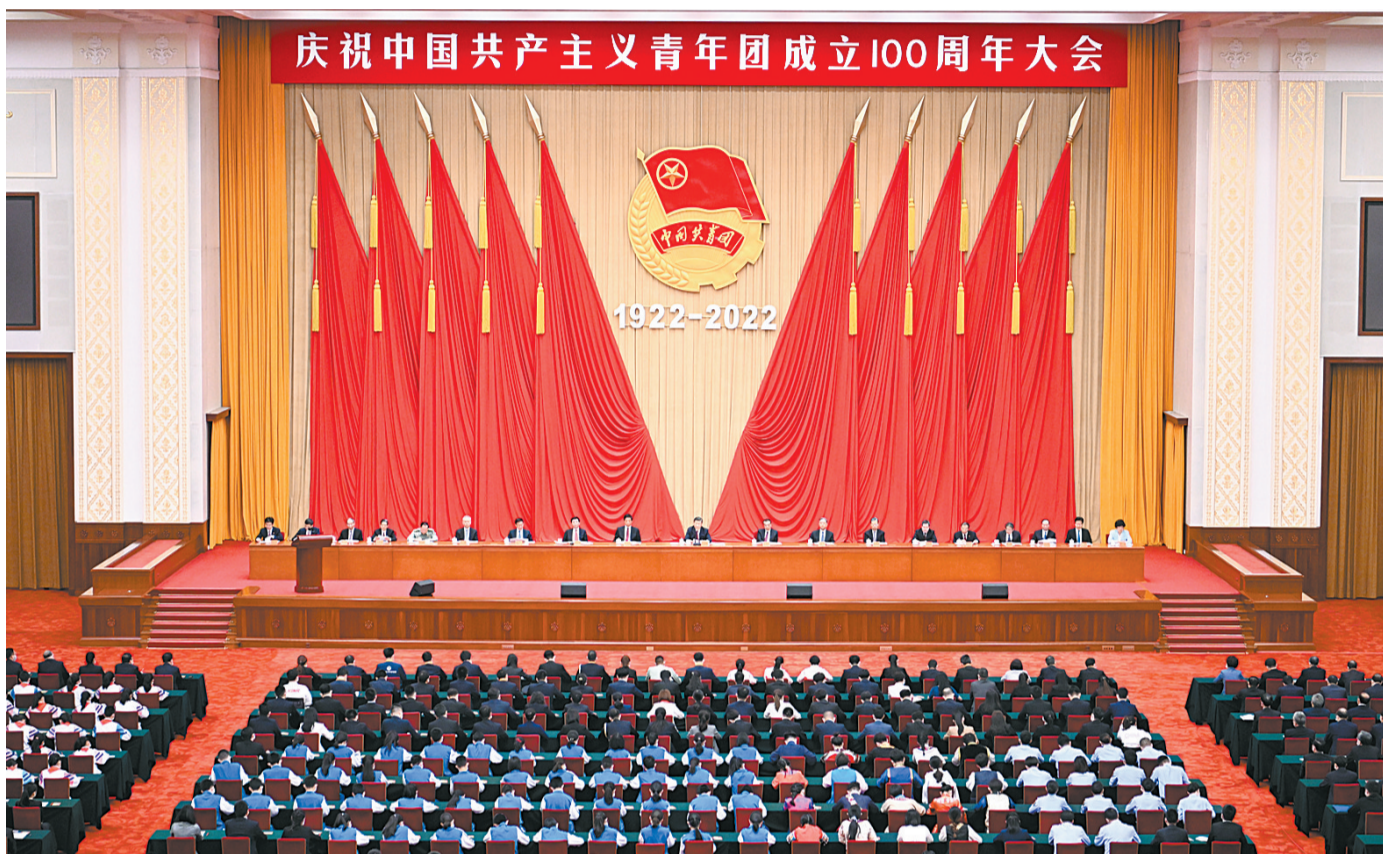
5月10日，庆祝中国共产主义青年团成立100周年大会在北京人民大会堂隆重举行。

新华社北京5月10日电 庆祝中国共产主义青年团成立100周年大会10日上午在北京人民大会堂隆重举行。中共中央总书记、国家主席、中央军委主席习近平在会上发表重要讲话，强调，青春孕育无限希望，青年创造美好明天。新时代的中国青年，生逢其时、重任在肩，施展才干的舞台无比广阔，实现梦想的前景无比光明。实现中国梦是一场历史接力赛，当代青年要在实现民族复兴的赛道上奋勇争先。共青团要牢牢把握培养社会主义建设者和接班人的根本任务，坚持为党育人、自觉担当