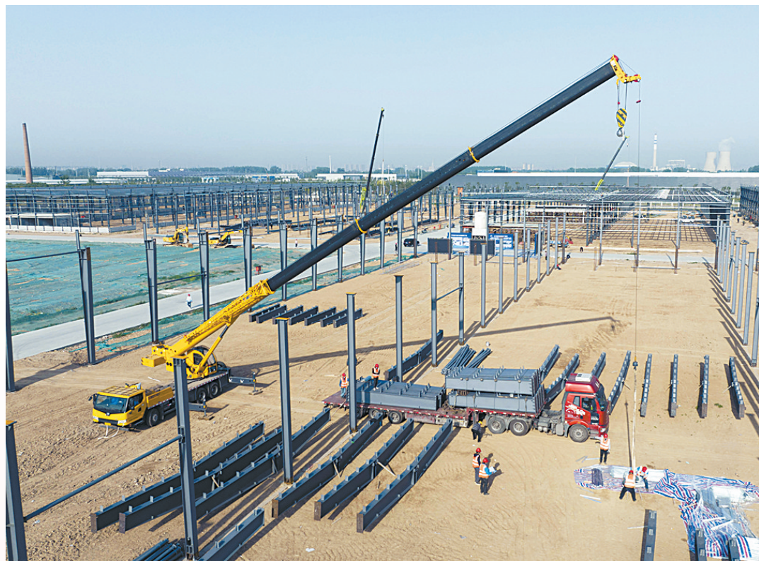
▲5月15日,工人们在项目施工现场忙碌着。示范区吉顺汽车零部件有限公司高端A型智能房车全系列产品智造基地及零部件园区项目(二期)总投资10亿元,主要生产新能源城市微卡及配套零部件等,全部建成投产后年产值可达25亿元。

简化审批流程,提高物资采购效率。积极落实疫情防控物资采购便利化政策,不断提高防控物资采购工作效率。迅速成立疫情防控物资保供小组,实行24小时值班制,科学调度、统筹安排,严格实行“一天一调度、一天一汇总、一天一更新”工作制度,做到了日清日结,确保各项保障工作有序、高效、规范、安全运行。