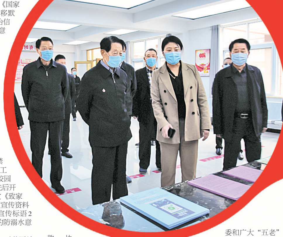
市、区关工委领导调研示范区中州街道办事处关心下一代工作。

款; 协调商丘市女企业家协会资助贫困大学生,女企业家们连续3年救助贫困大学生,每年捐助1万元,助力学生完成学业。截至目前,示范区关工委先后组织全区有关单位、企业、公司为贫困家庭大学生、留守儿童捐款90余万元。在疫情防控时期,示范区各级关工