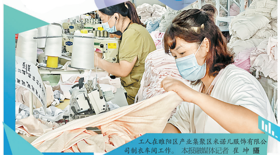
工人在睢阳区产业集聚区米诺儿服饰有限公司制衣车间工作。

稳市场主体稳就业 拓宽渠道增就业 抓重点群体保就业 强技能培训促就业 优就业服务帮就业 压实责任抓就业