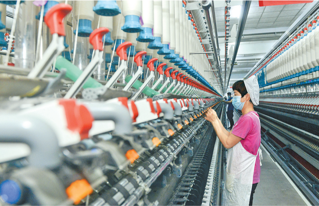
5月30日,工人在纺织车忙碌着。总投资80亿元的夏邑县恒天永安新织造100万锭高化纤纺织项目