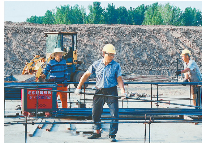
6月6日,施工人员在工地上忙碌着,为引江济淮工程预制地下涵管做准备。