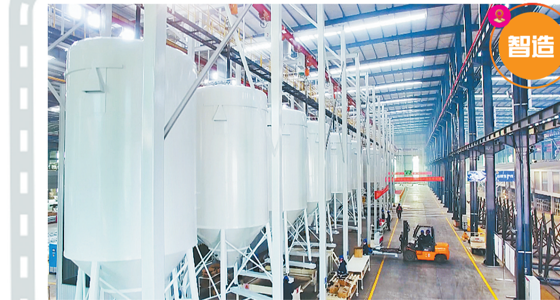
6月6日,在位于虞城县的筑润集团啤酒科技公司生产车间,工人们忙着装卸货物。该公司业务涉及干混砂浆配料设备及其信息管理系统、精酿鲜啤及其酿造设备、智能洗车机设备、压力容器封头等领域,公司注重智能化生产,通过智能数字平台把公司各项业务形成有机联系,推动区域智能制造产业链发展。