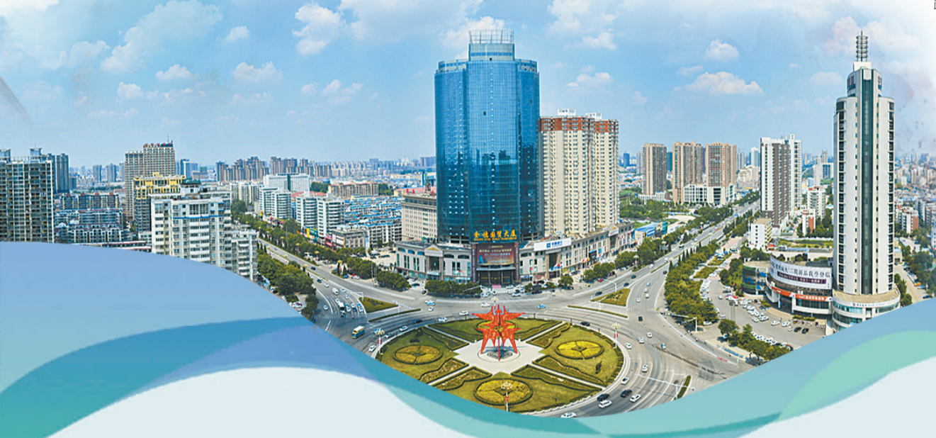
蓝天白云下的商丘城区。

袁正建说:“商丘要巩固来之不易的全国文明城市、国家卫生城市创建成果。加强城市精细化管理,不断提升城市建设中的文化含量,增加文化符号和城市街头艺术雕塑。”