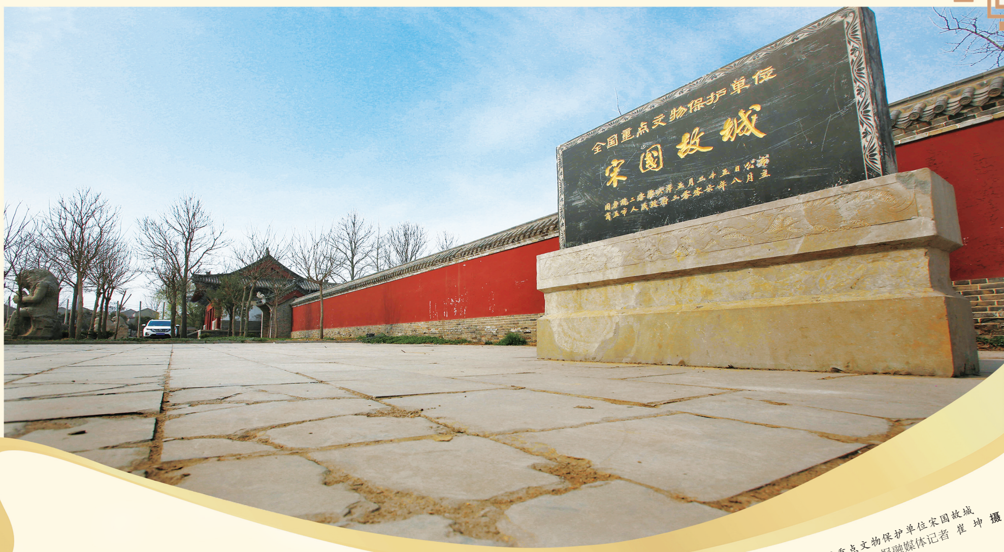
全国重点文物保护单位宋国故城

“殷商文化起源于商丘,兴盛于安阳。”商丘宋国故城考古发掘新发现,正在充分展示商丘“游商丘古城、读华夏文明史”的厚重文化历史,全面展现商丘古城“一城阅尽五千年”“中国古城池天然博物馆”的无限魅力。