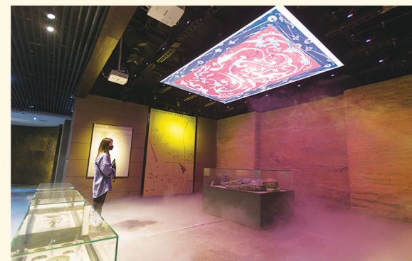
数字化升级改造后的商丘博物馆让游客参观更加身临其境。