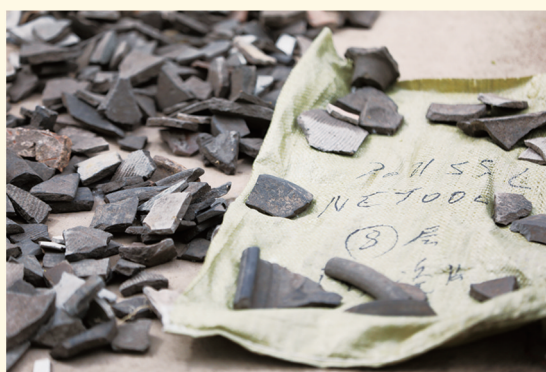
宋国故城考古出土的陶片、瓷片等文物标本。