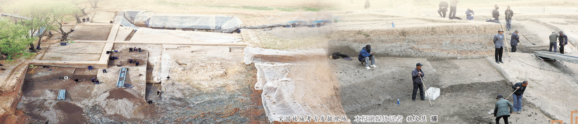
宋国故城考古发掘现场。