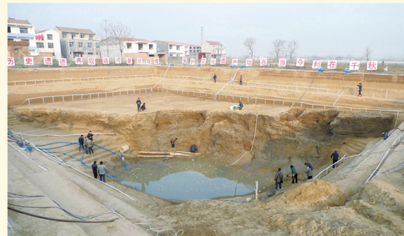
千年前大运河在商丘揭开神秘面纱。