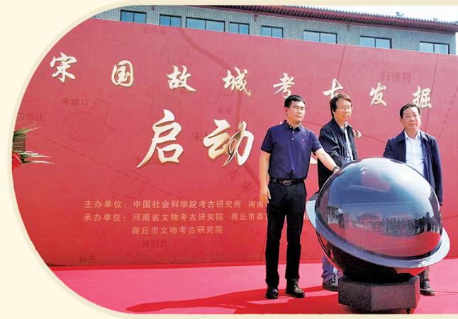
2021年5月20日,商丘宋国故城考古发掘项目正式启动。

“从目前宋国故城的考古发掘来看,已经找到明代的活动面,也已确认明城被洪水冲毁后的淤积层,正在寻找宋代的活动面。下一步计划解剖宋代城墙,看看宋代城墙之下,是否叠压着汉梁时期城墙;汉梁城墙之下,是否还叠压着两周城墙,甚至还有更早的商代城墙。”岳洪彬说。