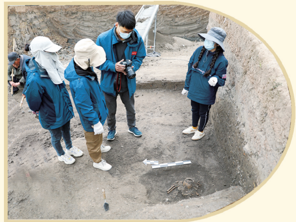
宋国故城考古工作者认真分析文化堆积层和出土文物。