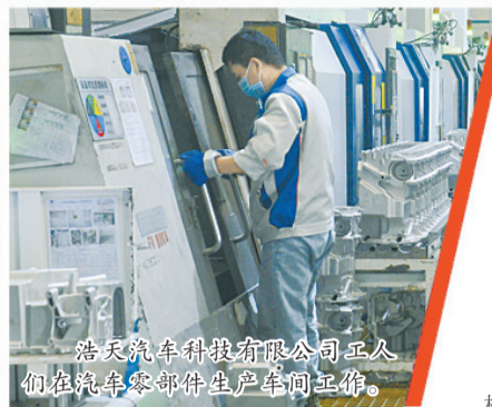
浩天汽车科技股份有限公司工人们在汽车零部件生产车间工作。