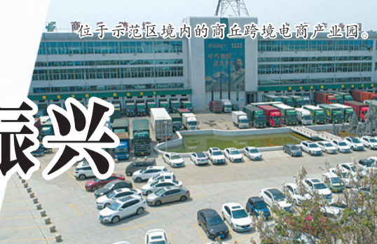
位于示范区境内的商丘跨境电商产业园。