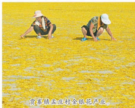
贾寨镇孟庄村金银花产业。