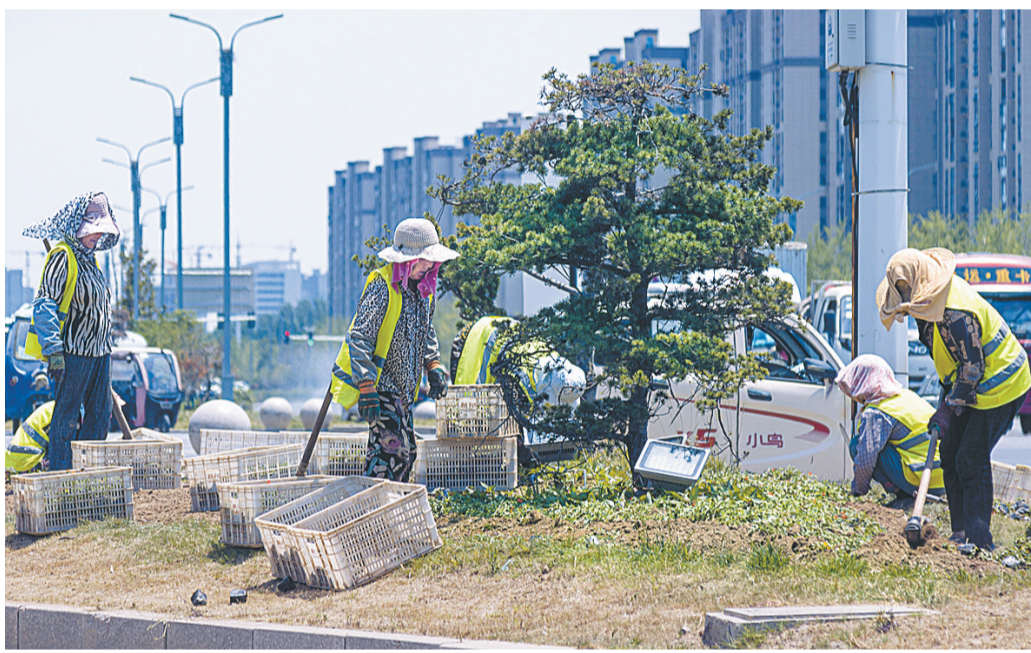
6月20日,园林工人在华商大道与归德路交叉口分流岛内栽种时令花卉,进一步提升绿化美化档次,使道路景观鲜花常开。