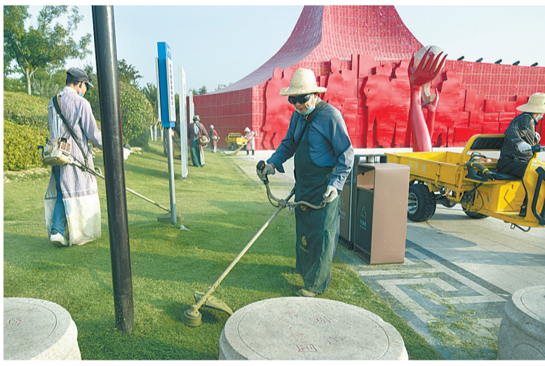
6月20日,园林工人在日月湖景区修剪草坪,保持良好的景区绿化效果,为市民创造良好的休闲游玩环境。