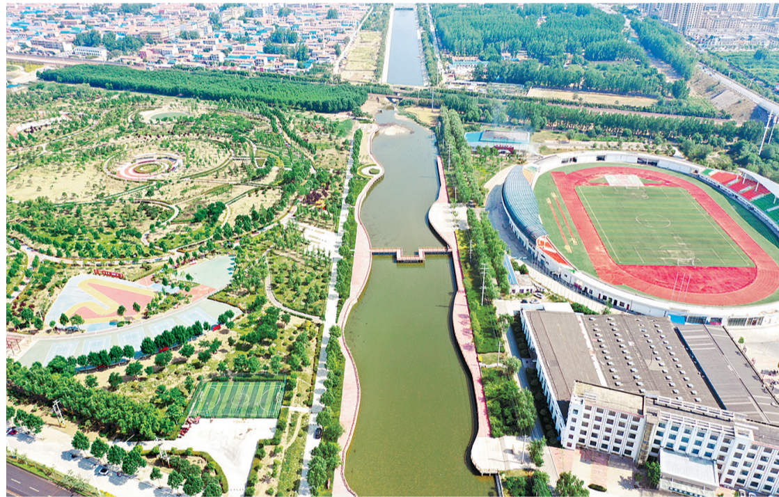
6月23日,一湾清水穿过民权县奥林匹克公园,给城市增添无限生机。据悉,近年来,该县生态水系工程润活了城市灵性,相继荣获“国家园林县城”“省级卫生城”“全国文明城市(提名城市)”等称号。本报融媒体记者 闫鹏亮 摄