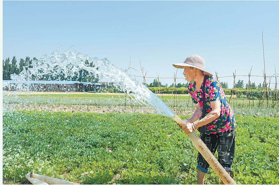
6月22日,民权县人和镇内西村的村民在抗旱保苗。据悉,该镇结合能力作风建设活动,采取政策宣传、技术指导、结对帮扶等多种措施,积极引导群众充分利用现有水源,造墒抢种、浇地保苗,迅速掀起抗旱高潮,为夺取秋粮丰收奠定坚实基础。

政民一家亲,点滴汇真情。民权县12345政务服务便民热线办负责人告诉记者,热线是“民生”直通车,也是“民声”直通车。通过热线不仅能为群众办实事,也是“好事小喇叭”。宣传这些好人好事,传递社会正能量,以此激励工作人员,提高服务意识,及时、有效回应民情民意。