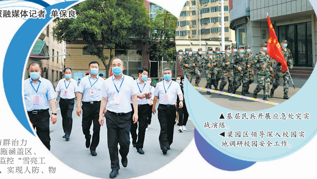
▲基层民兵开展应急处突实战演练。 ▲梁园区领导深入校园实地调研校园安全工作。

今年以来，梁园区政法系统全面落实中央、省委、市委、区委关于平安建设工作的决策部署，以全面从严治党为统领，以“喜迎党的二十大”为主线，以“三零”创建为标志，以“四治融合”为路径，以“五个不发生”为底线，结合梁园区实际，锚定“社会治理越来越扎实、信访稳定越来越牢固”目标，抓重点、破难点、创亮点，牢牢扛起防范化解风险、确保一方平安的政治责任，努力建设更高水平的平安梁园、法治梁园。