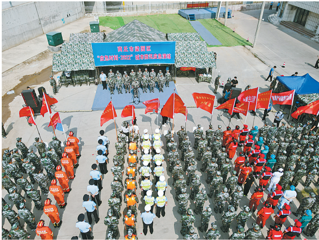
为保障人民群众生命财产安全，进入6月份以来，梁园区着力开展抢险救灾实战演练，组织消防官兵、基层民兵、社区干部、卫生医疗等重点行业人员参加集训，确保关键时刻拉得出、冲得上、打得赢。

下一步，该镇将继续坚持力度不减、标准不降、要求严格的务实作风，持续推进人居环境整治工作，巩固人居环境整治成果，让乡村净起来、绿起来、美起来、靓起来。