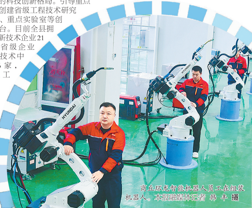
商丘环龙智能机器人员工在组装机器人。