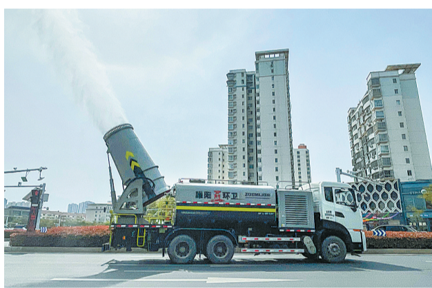
6月29日,一辆雾炮车在神火大道进行降尘作业,抑制扬尘污染,改善城市空气质量。