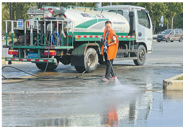
6月29日,环卫工人使用高压水枪,对平原路人行道进行冲洗,提高道路洁净度,靓化城区环境。