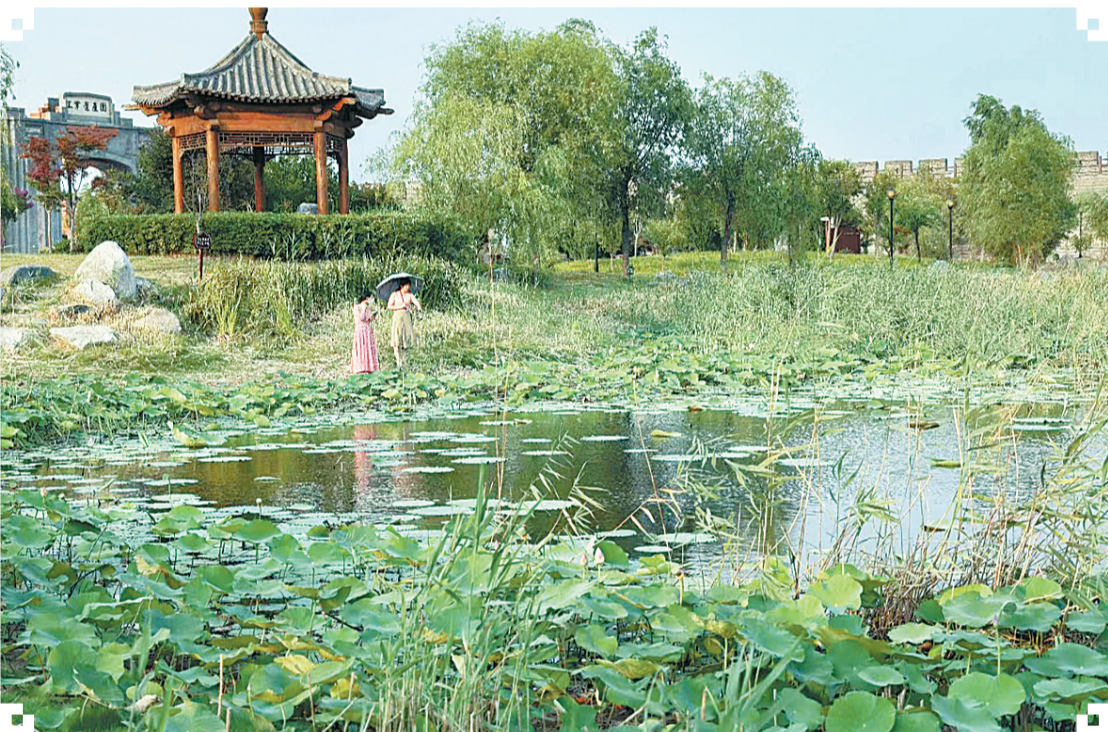
市民冒着酷暑来到商丘古城凤池赏荷花。