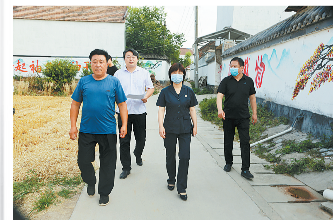
近日,柘城县人民法院党组书记、院长翟咏华深入扶贫联系点陈青集镇王楼村,实地调研巩固脱贫攻坚与乡村振兴有效衔接工作开展情况,并走访慰问分包的脱贫户,深入了解他们的家庭情况、健康状况、收入来源、生活开支、子女上学就业及帮扶政策落实等情况。