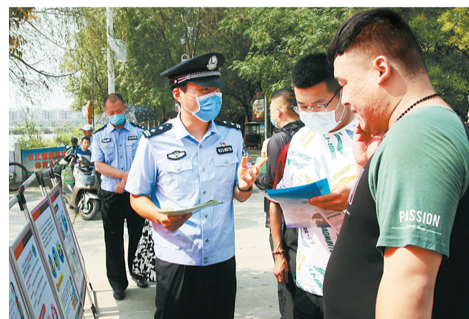
今年6月以来,市强制隔离戒毒所通过“三个加强”积极开展禁毒月系列宣讲活动,实现线上与线下同频共振,推动业务和普法同向而行,让禁毒知识飞入寻常百姓家,助力打通全民禁毒工作的“最后一公里”。

会后,干警们纷纷表示,要深刻学习领会专题党课内容,把学习成效转化为工作动力,用自己的实际行动推动夏邑检察工作取得新作为、实现新进步,以优异成绩迎接党的二十大胜利召开。