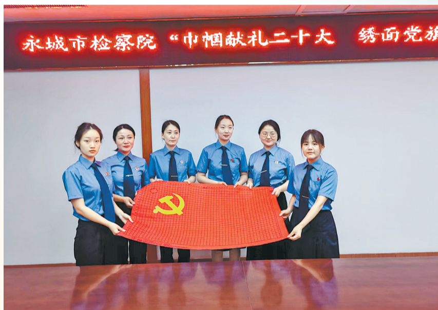
6月27日,永城市人民检察院开展“巾帼献礼二十大 绣面党旗庆七一”主题活动,女干警们手执针线在鲜艳的党旗上饱含深情地绣下属于自己的每一针一线,把对党的热爱和忠诚绣进了党旗,更把党员的初心和使命绣进了党旗。