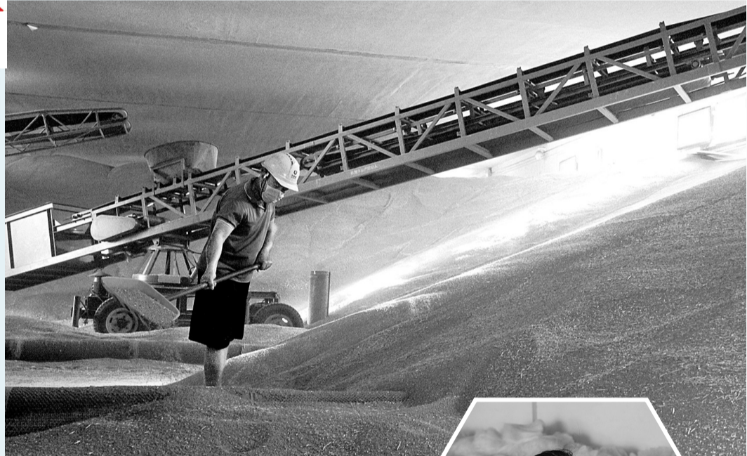
▲近日，在中央储备粮永城直属库有限公司院内，工作人员有条不紊地将收购的新小麦化验、过磅、入库，严把入库质检关口，确保有序收粮、顺畅售粮、安全储粮。

本报讯(记者 高会鹏)日前，市纪委监委市场监管局纪检组到虞城县开展夏粮收购市场秩序督导调研，详细了解国有粮食收储企业及粮食经纪人等在夏粮收购过程中使用的计量器具是否检定合格、粮食收购价格是否遵守国家相关政策规定等情况。 在虞城县国有粮库，督导组通过现场查看、询问交流等方式调研了夏粮收购情况、最低保护价政策执行情况以及计量器具检定情况。在虞城县芒种桥乡、站集镇粮食收购点，督导组对检查发现的未悬挂经营许可证、明码标价不规范等现象，现场指导进行了整改。 调研期间，督导组一行详细询问了虞城县市场监督管理局立足职能服务“三夏”生产和夏粮收购市场监管工作开展情况，对该局开展粮食收购市场监管工作予以肯定。督导组要求：一要提高政治站位，充分认识“三夏”生产和夏粮收购市场监管的重要性。二要履职尽责，提升监管水平。要通过新闻媒体、微信公众号加强法律法规政策宣传，畅通12315热线等举报投诉渠道，及时受理、高效处理投诉举报，做到事事有落实，件件有回音；要加大粮食收购市场监管力度，督促国有粮食企业及基层粮点要建立购销台账。三要加强部门联动，确保取得实效。