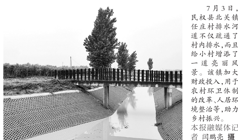
7月3日，民权县北关镇任庄村排水河道不仅疏通了村内排水，而且给小村增添了一道亮丽风景。该镇加大财政投入，用于农村环卫体制的改革、人居环境整治等，助力乡村振兴。

奋斗是青春最亮丽的底色，行动是青年最有效的磨砺。有责任有担当，青春才会闪光。夏龙说，作为一名当代青年，要在党和人民最需要的时刻冲得出来、顶得上去，努力成为有理想、敢担当、能吃苦、肯奋斗的新时代好青年。同时，他将继承发扬共青团“党有号召、团有行动”的优良传统，自觉把青春奋斗融入新时代消防救援事业建设发展的新征程中，哪里有危险，就奔赴哪里，哪里有需要，就出现在哪里，以冲锋的姿态做火场救援的逆行者，用拼搏和忠诚书写流光溢彩的青春岁月。