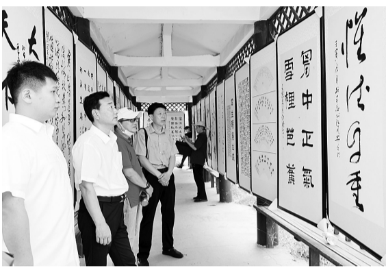
7月1日，虞城县刘店乡张庄村庆“七一”首届农民书画展开幕，此次展览展出书画作品60幅。