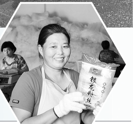
▶7月3日，夏邑县城关镇西关村村民在包装粉丝。该镇有粉丝厂20余家，安排1000余人就业，成为乡村振兴主导产业。